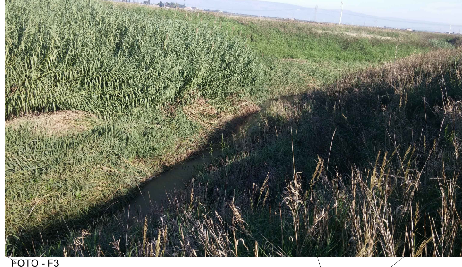
FOTO - F3