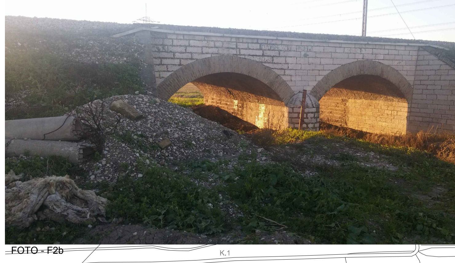
FOTO - F2b