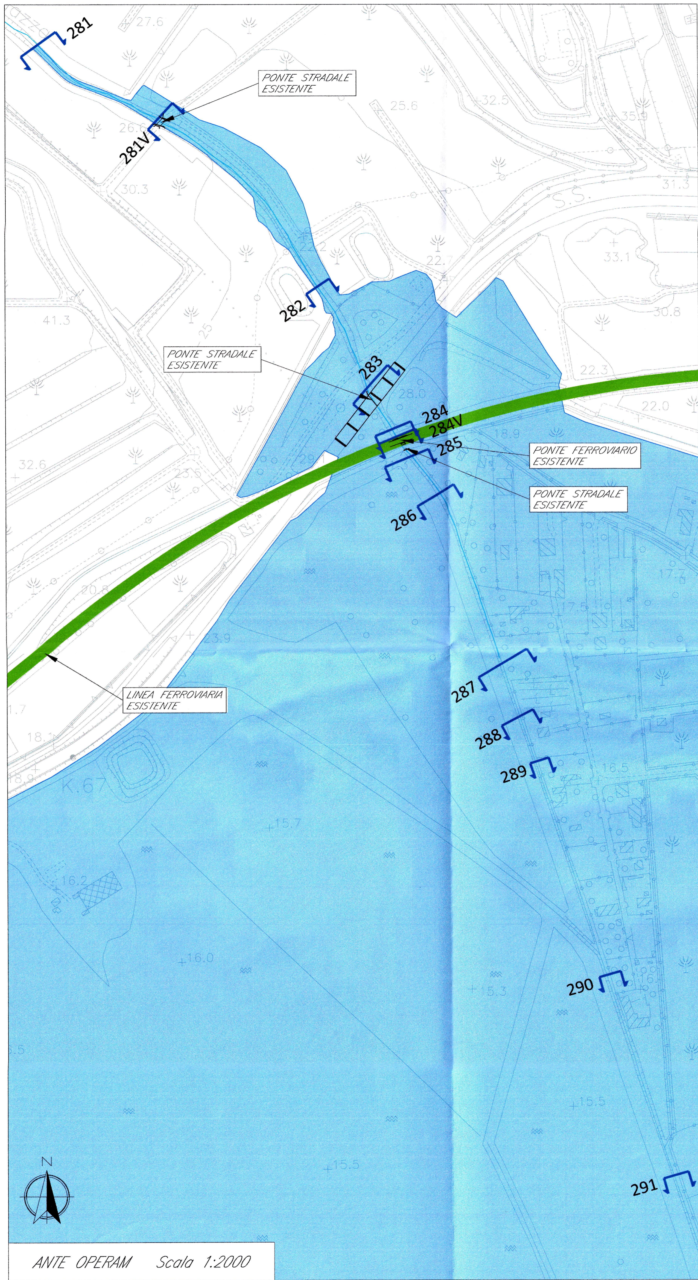
ANTE OPERAM Scala 1:2000