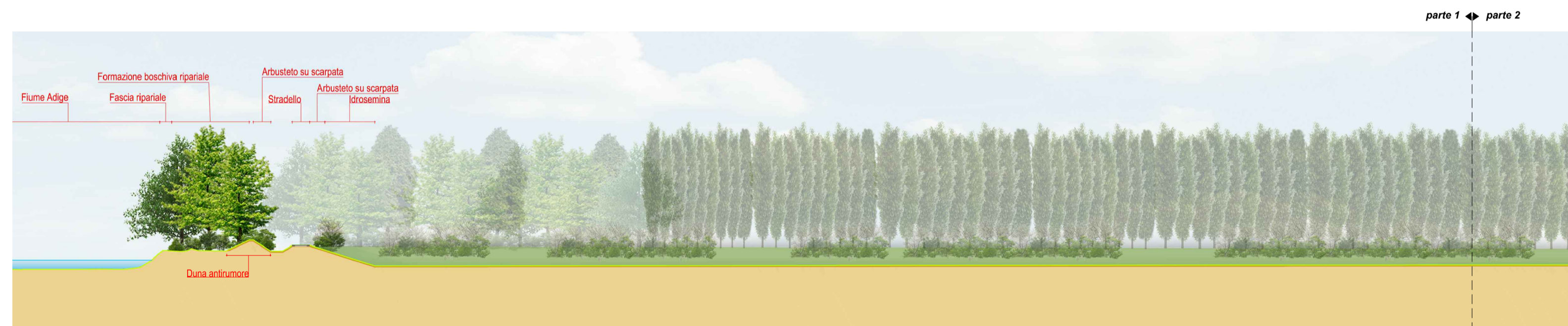
SEZIONE BB' - parte 1 scala 1:1000