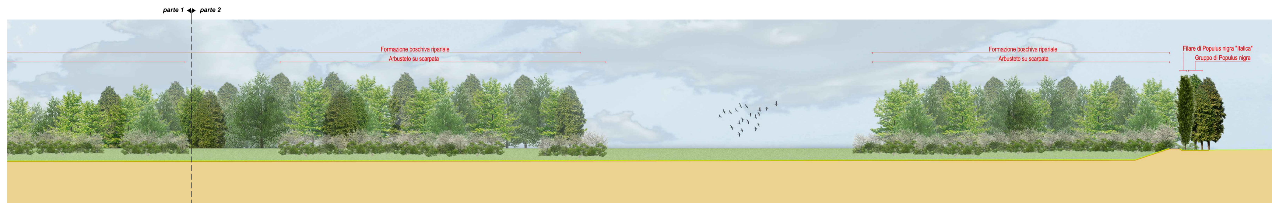
SEZIONE AA' - parte 2 scala 1:1000