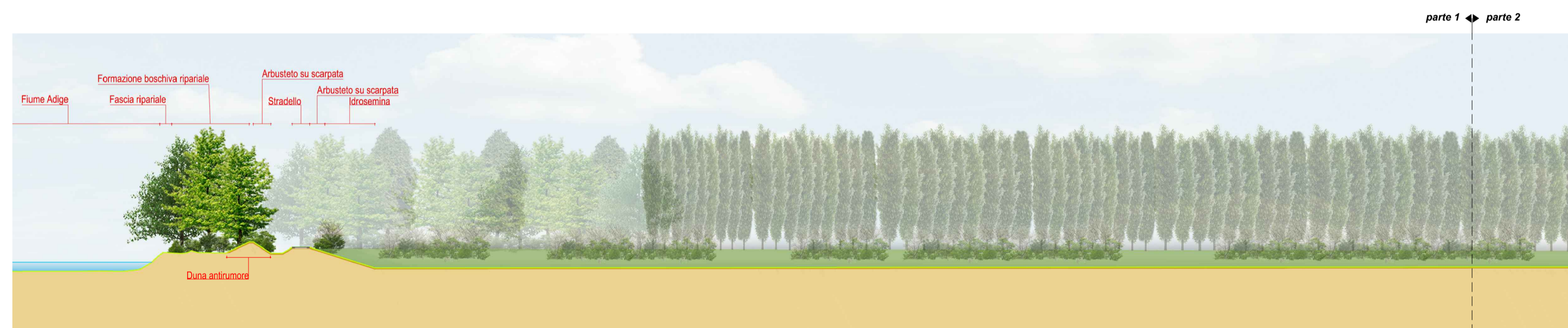
SEZIONE BB' - parte 1 scala 1:1000