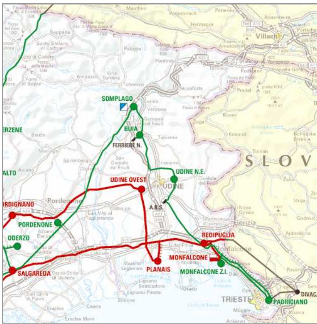
Figura 1 - Rete elettrica AAT in Friuli Venezia Giulia

Così come strutturata, la rete elettrica friulana risulta squilibrata sulla stazione elettrica di Redipuglia, attraverso la quale transitano sia i flussi di potenza provenienti dall'interconnessione Italia-Slovenia (nodo di Divaca), sia la