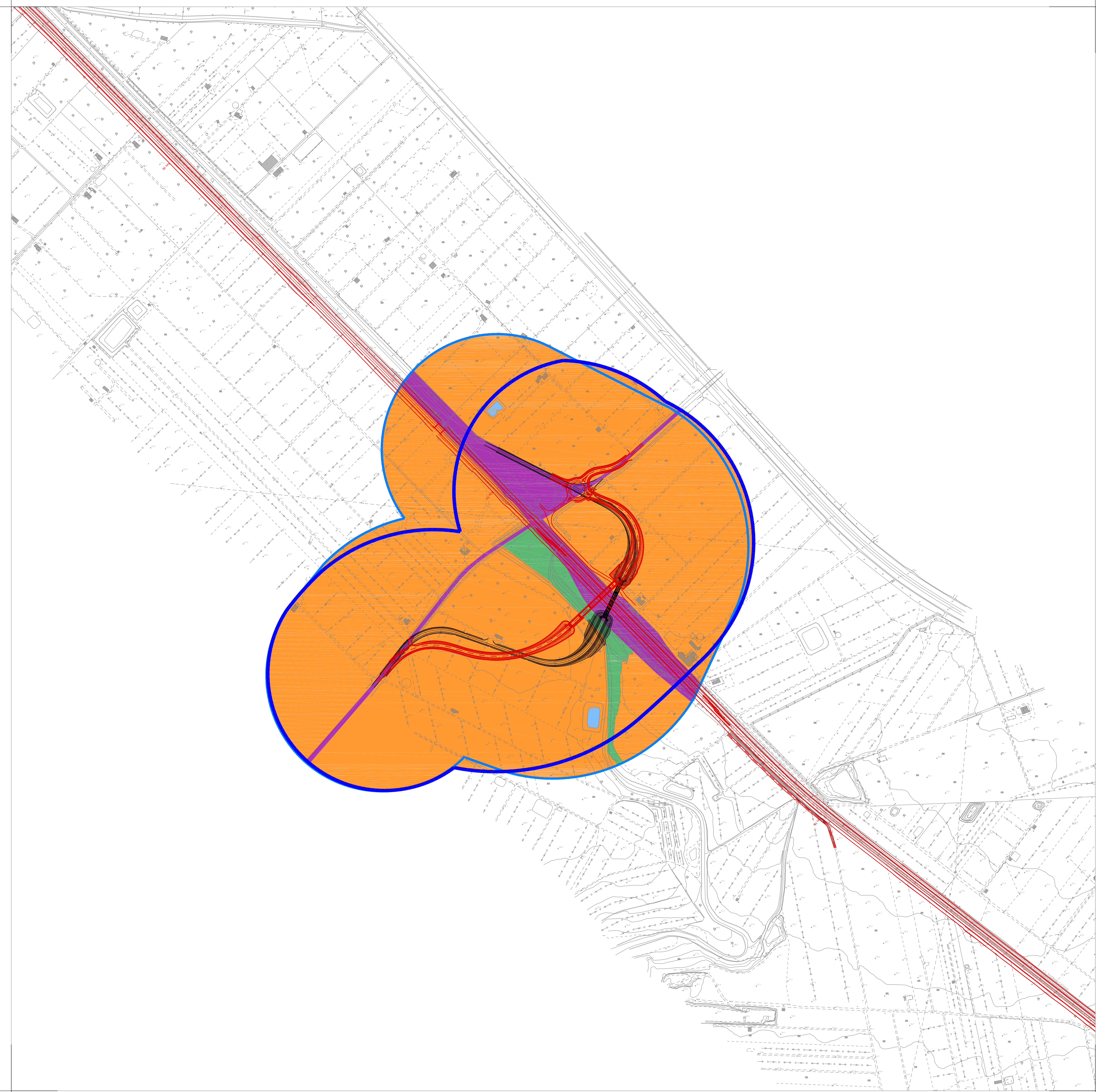
B Prog. Km 17+324 Cavalcaferrovia IV03