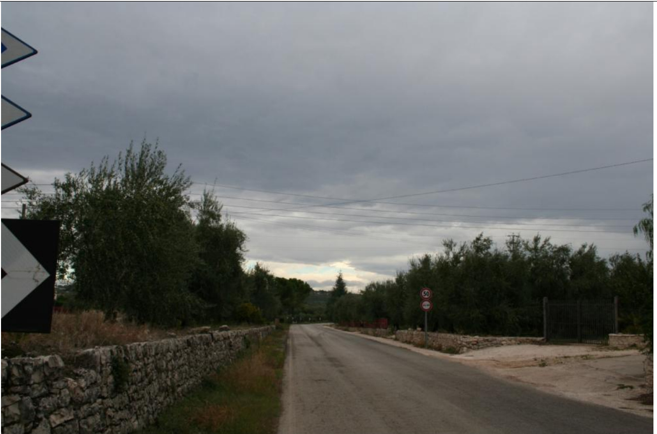
Fotoinserimento Punto visuale PV1 - Post