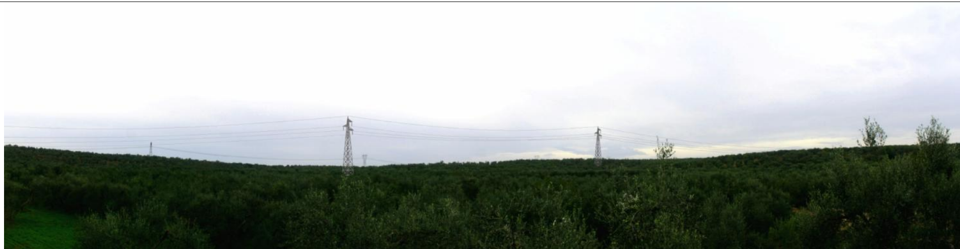
Fotoinserimento Punto visuale PV5 - Post