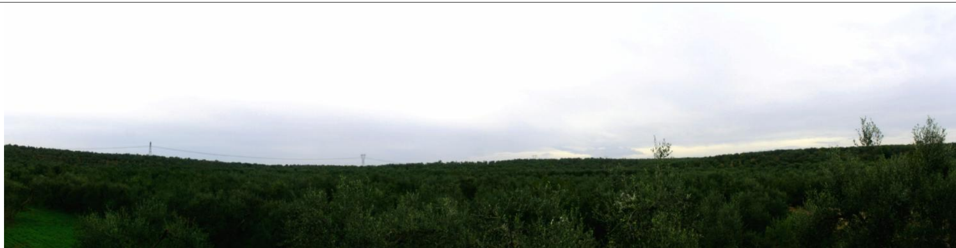
Punto visuale PV5 - Ante