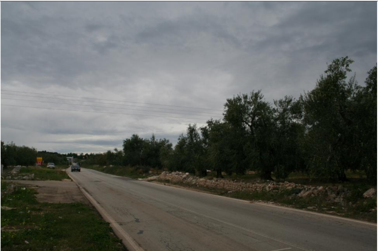
Fotoinserimento Punto visuale PV2 - Post