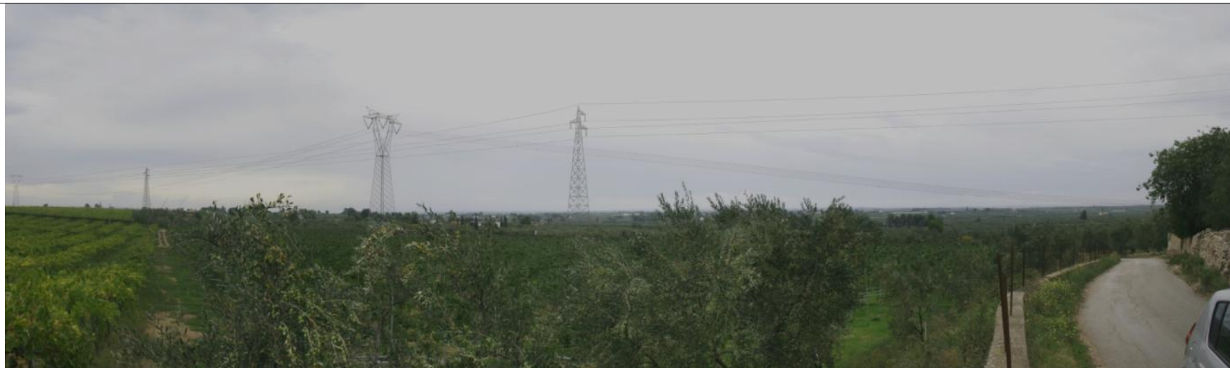
Fotoinserimento Punto visuale PV4 - Post