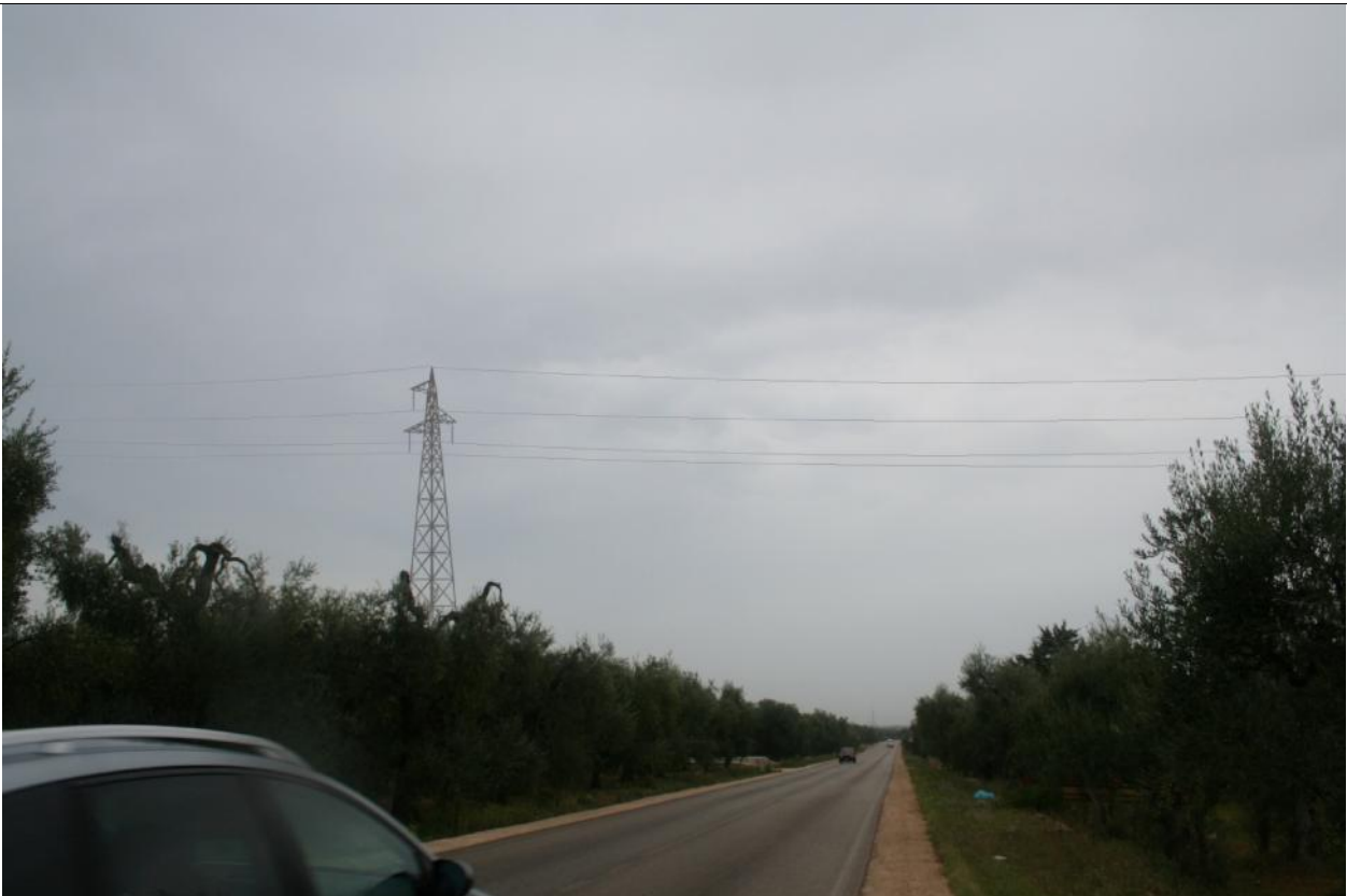
Fotoinserimento Punto visuale PV6 - Post