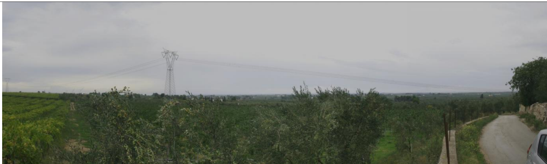
Punto visuale PV4 - Ante