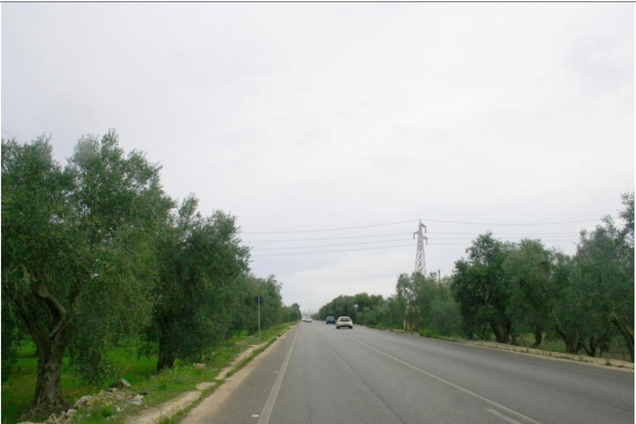
Fotoinserimento Punto visuale PV7 - Post