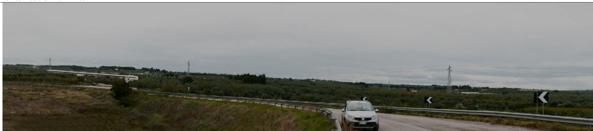
Fotoinserimento Punto visuale PV3 - Post