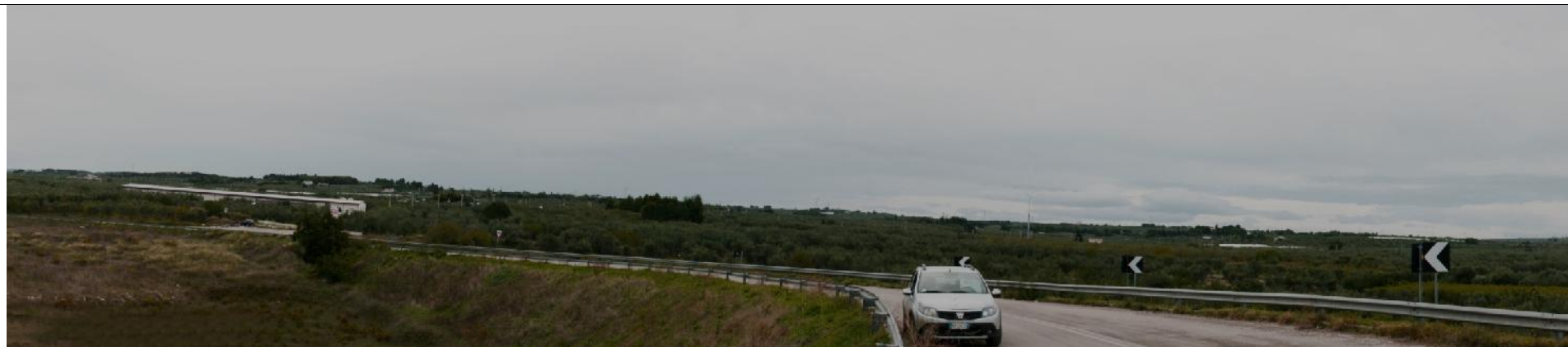
Punto visuale PV3 - Ante