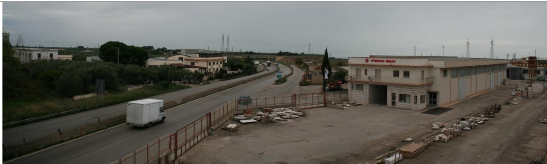
Punto visuale PV8 - Ante