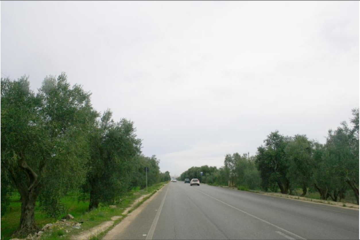
Punto visuale PV7 - Ante