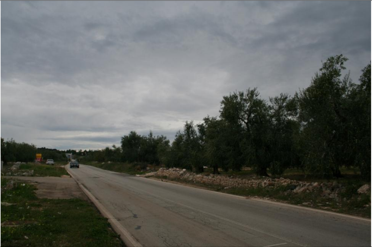
Punto visuale PV2 - Ante