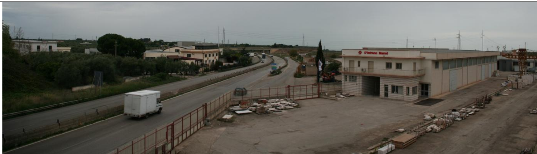
Fotoinserimento Punto visuale PV8 - Post