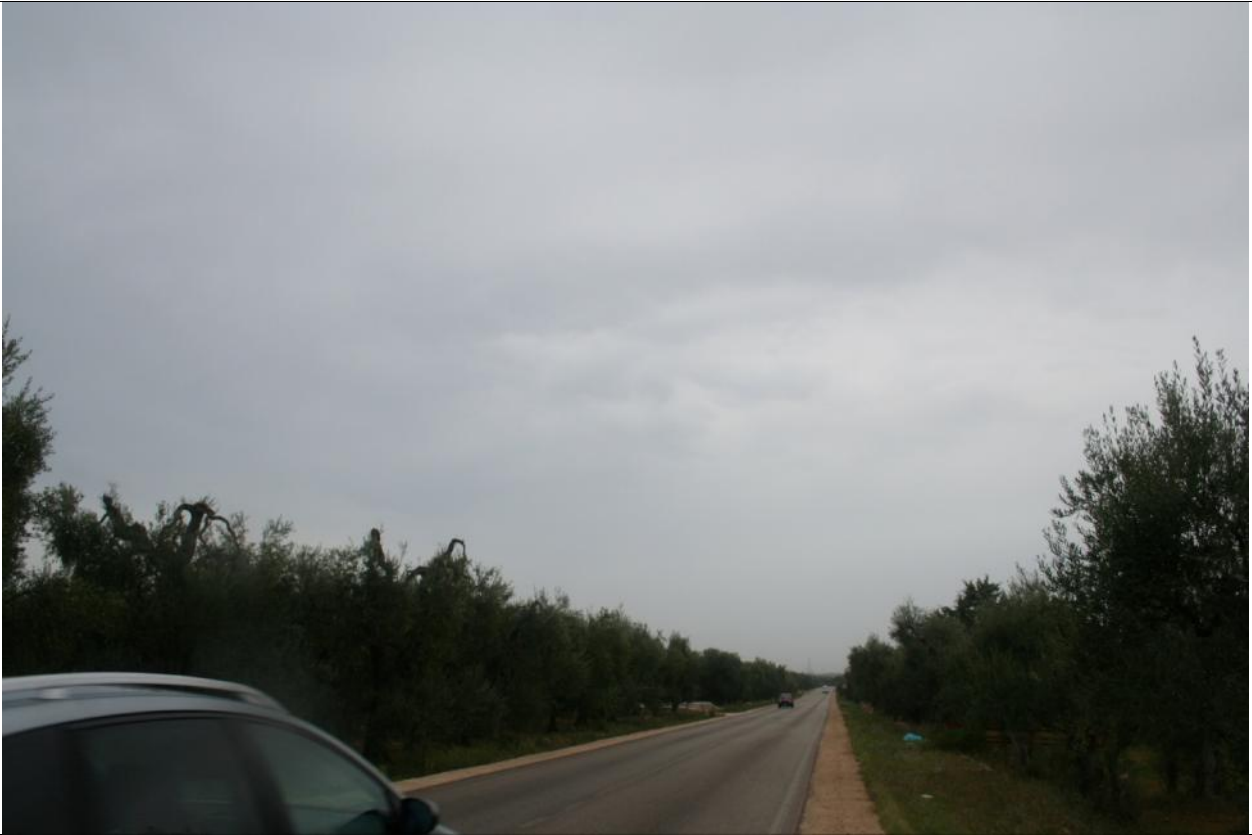
Punto visuale PV6 - Ante