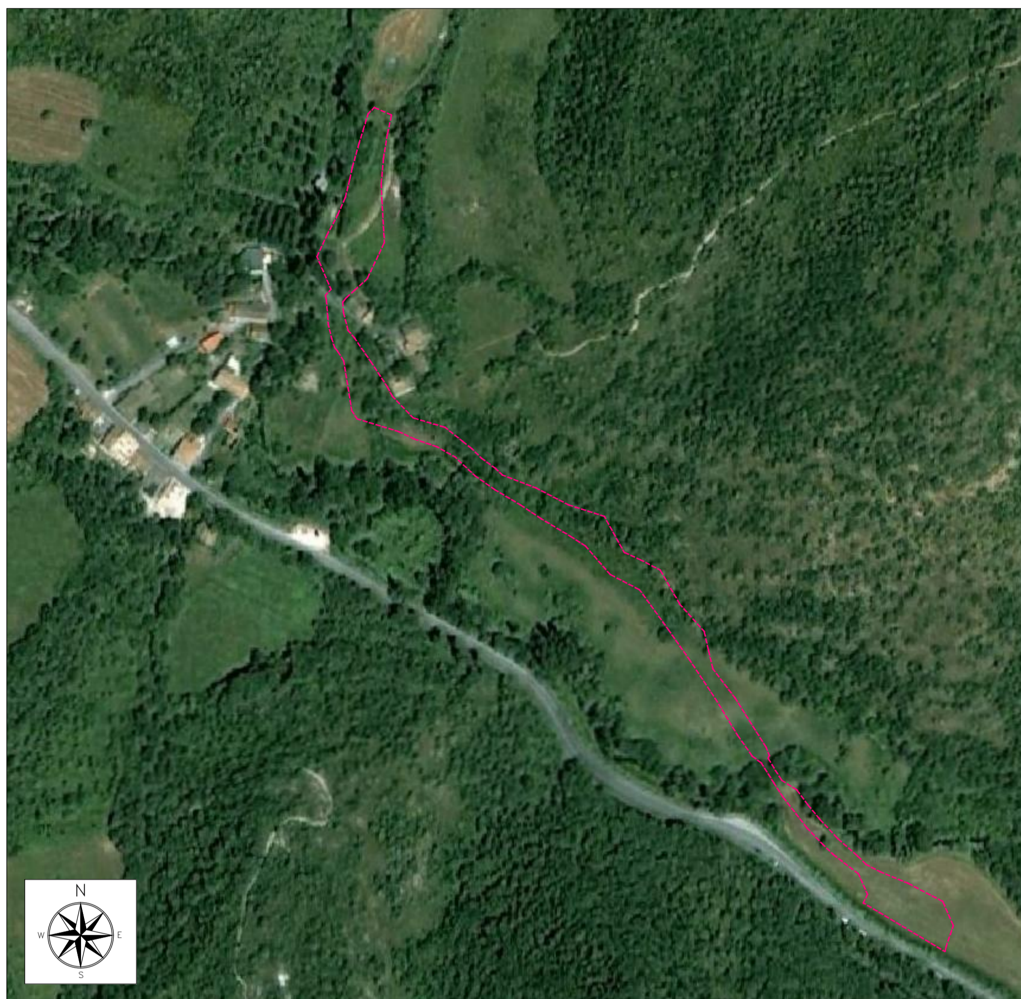
ORTOFOTO DI INQUADRAMENTO - SCALA 1:2000