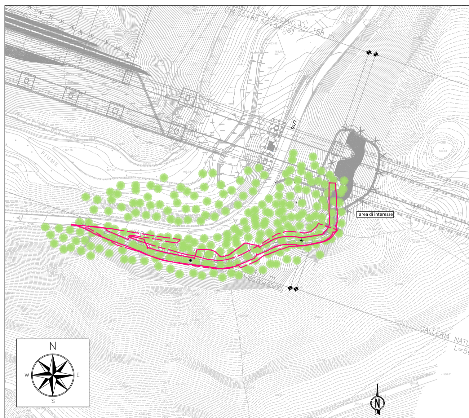
PLANIMETRIA DI INQUADRAMENTO - SCALA 1:2000