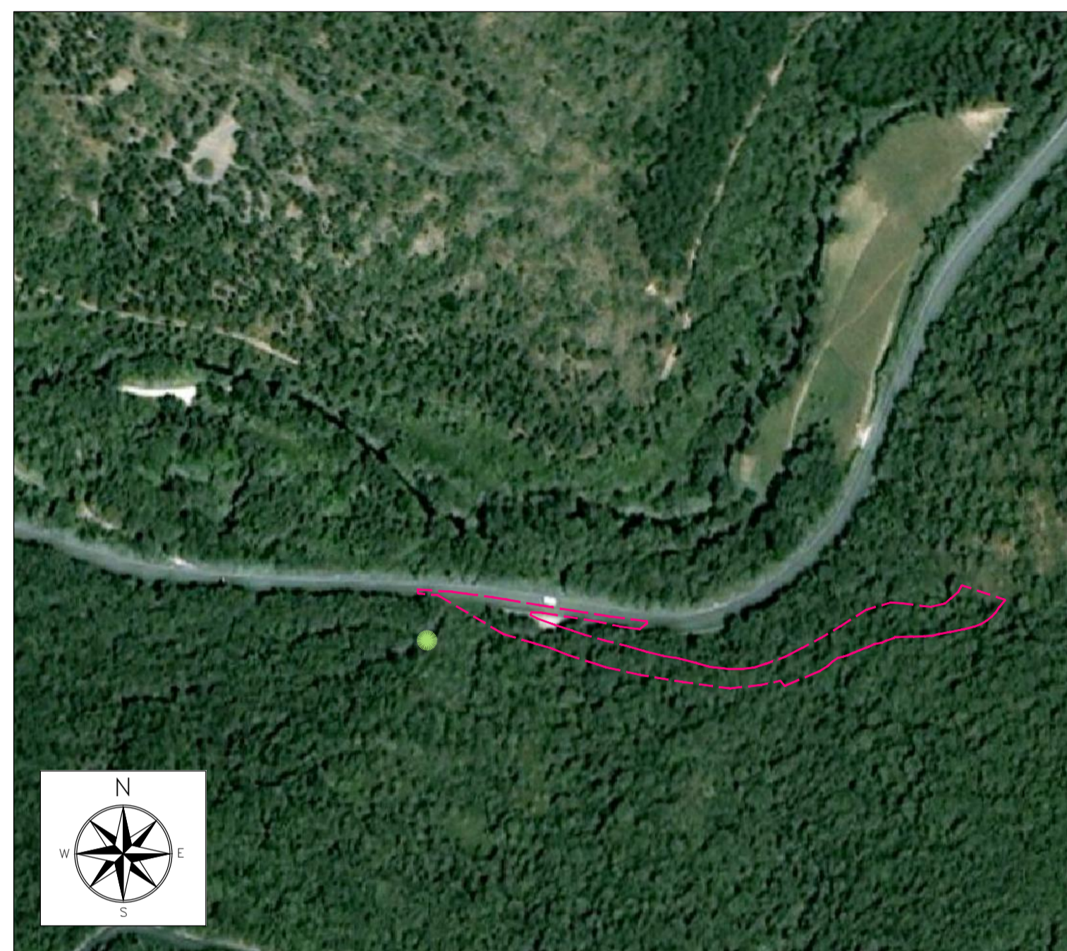
ORTOFOTO DI INQUADRAMENTO - SCALA 1:2000