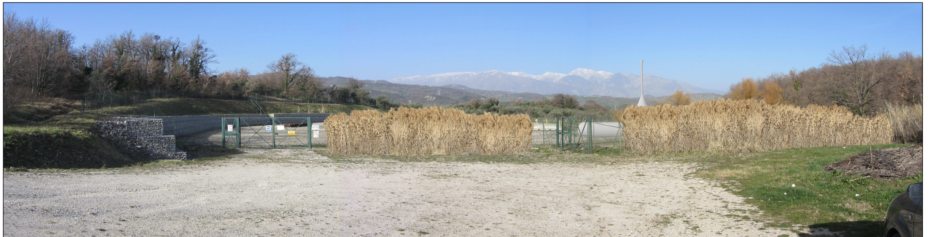
Fotosimulazione 04 L'Area Pozzi "Monte Pallano 1-2" di Bomba con mitigazione del fronte principale con una quinta di canneto (periodo invernale).