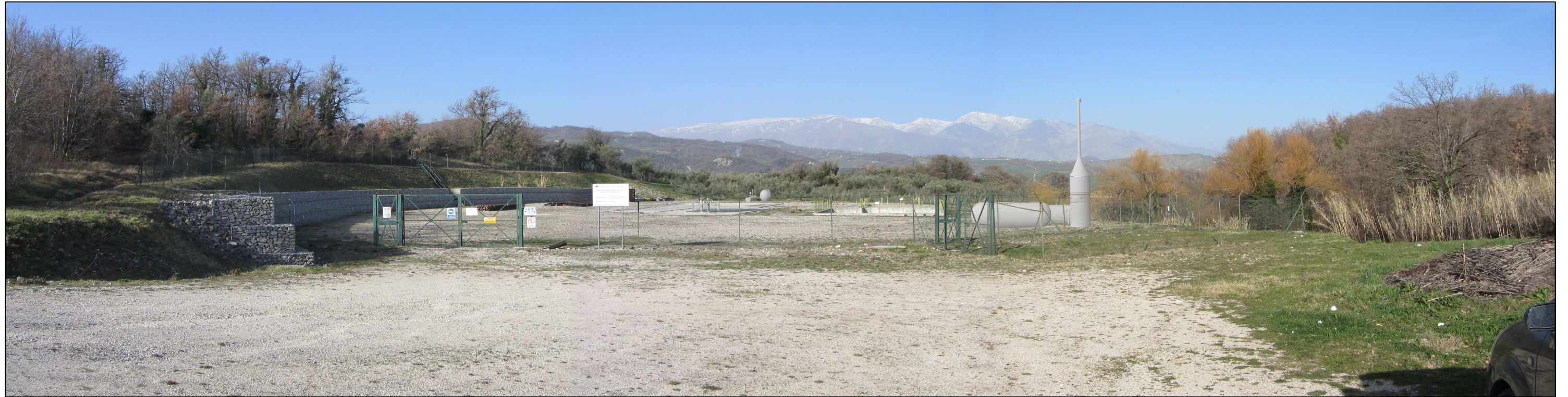
Fotosimulazione 03 L'Area Pozzi "Monte Pallano 1-2" di Bomba a fine lavori (cfr. Documentazione fotografica scatto n°1).