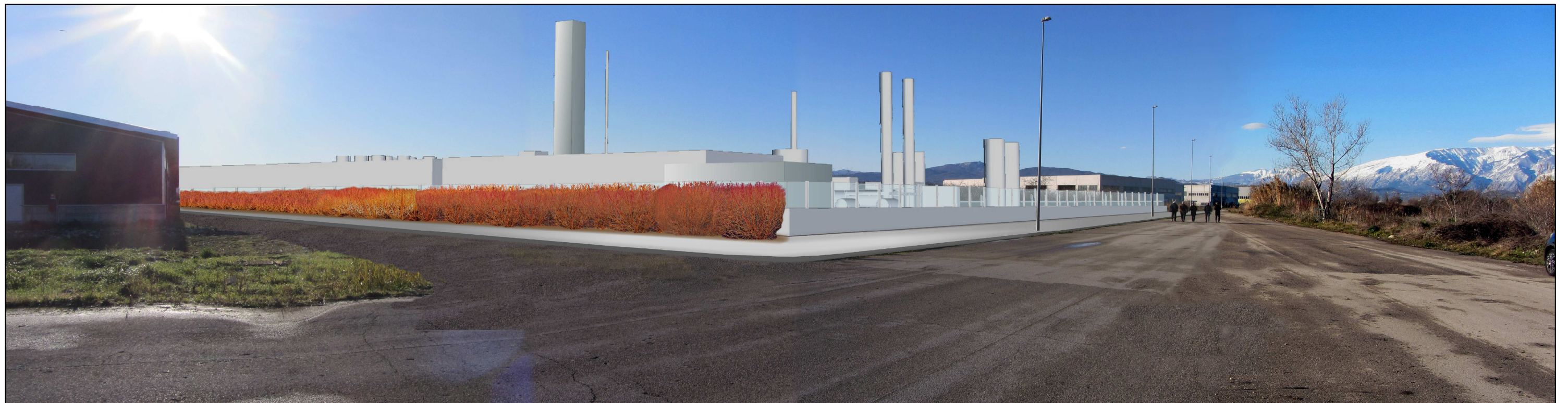
Fotosimulazione 02 La Centrale di trattamento di Paglieta con mitigazione dell'ingresso carrabile mediante filare di Cornus sanguinea (periodo invernale).