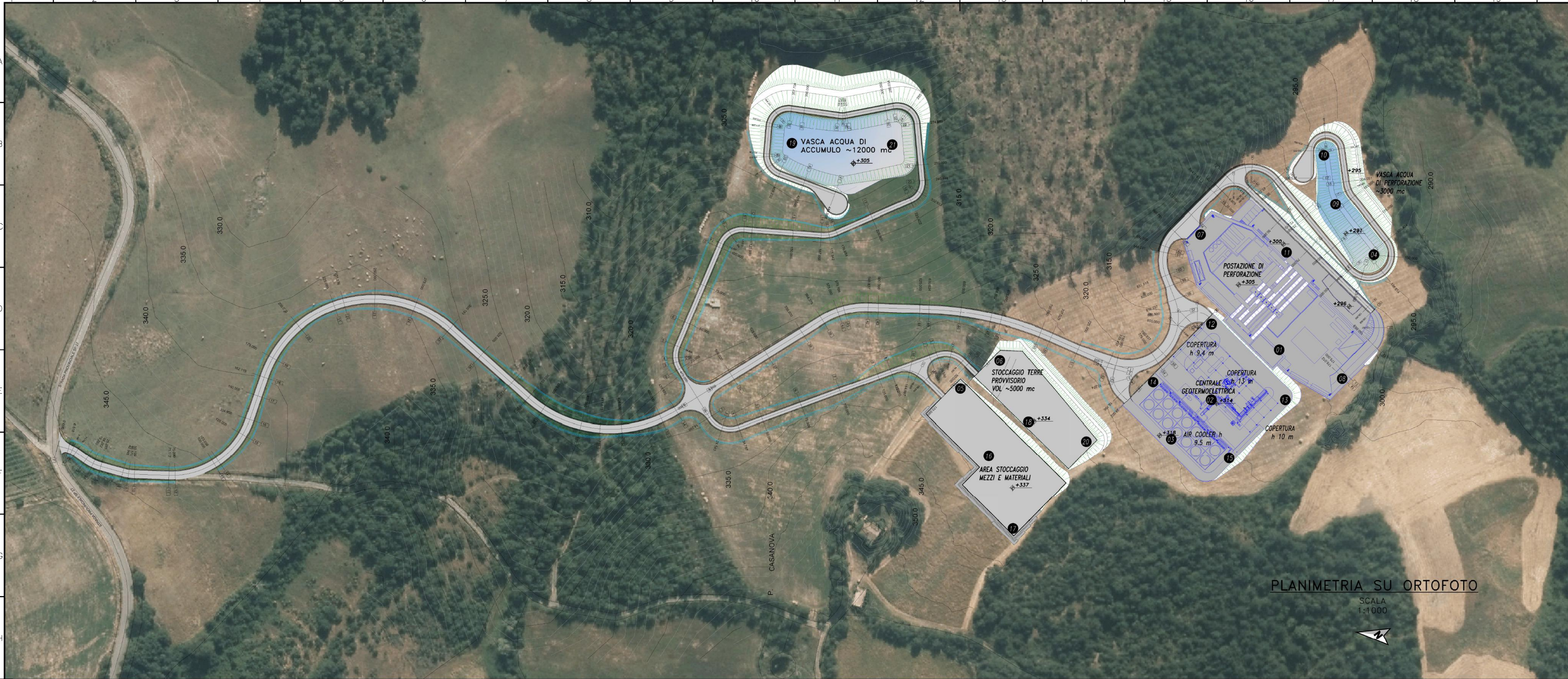
PLANIMETRIA SU ORTOFOTO