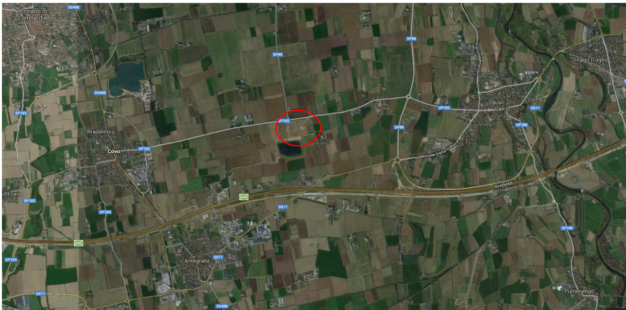
Figura 0-1: Ubicazione area di cava

L'area estrattiva individuata è sita ad est dell'abitato di Covo e immediatamente a nord della costruenda linea ferroviaria.