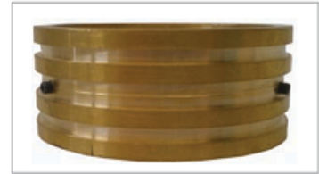
Particolare anello ottone.