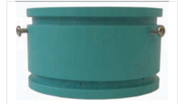
Particolare anello magnetico