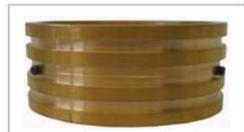
Particolare anello ottone.