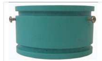
Particolare anello magnetico.