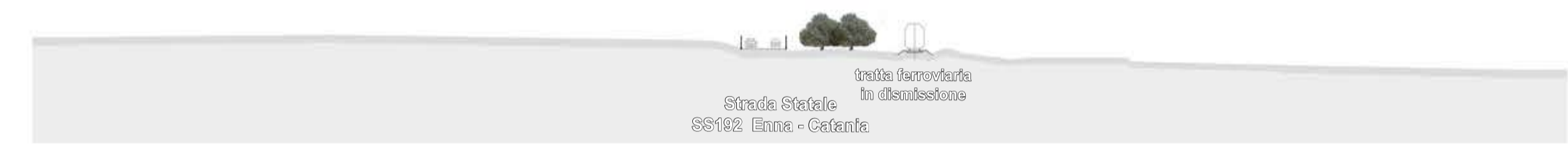
Sezione _ ante operam