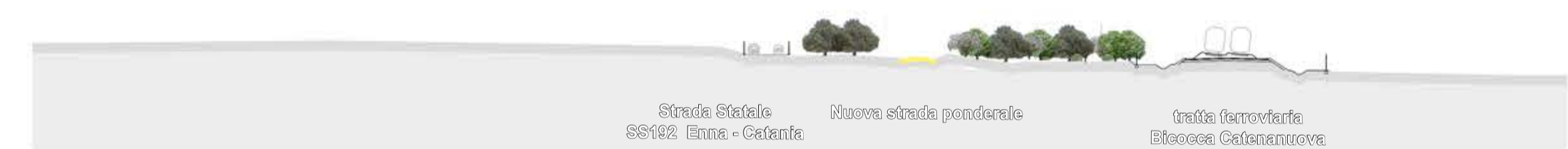
Sezione _ post operam