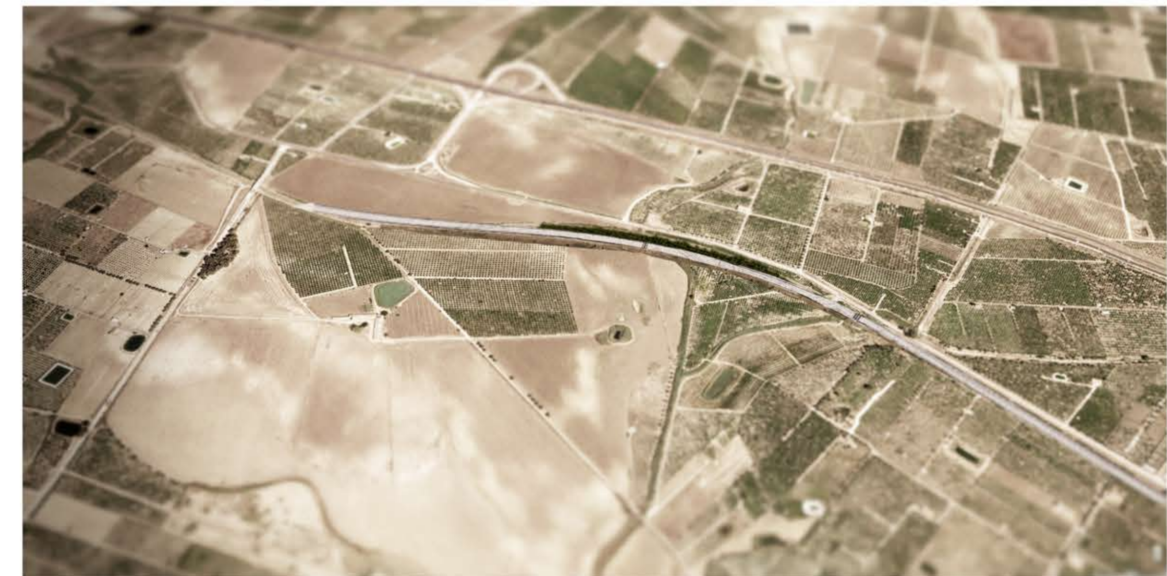
Vista Assonometrica Intervento