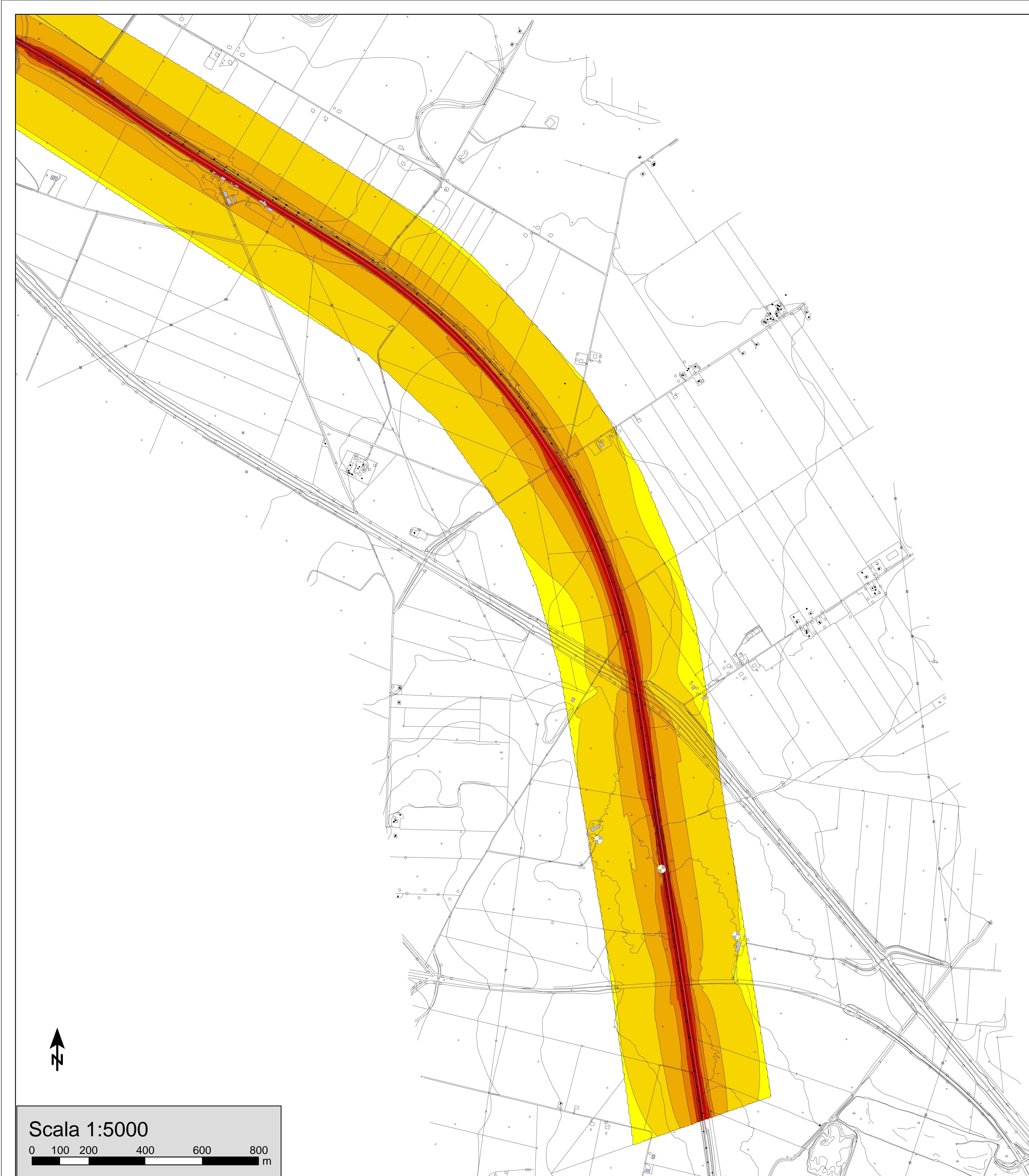
TAVOLA 2 MAPPA RUMORE QUOTA h=4m ANTE OPERAM - PERIODO DIURNO