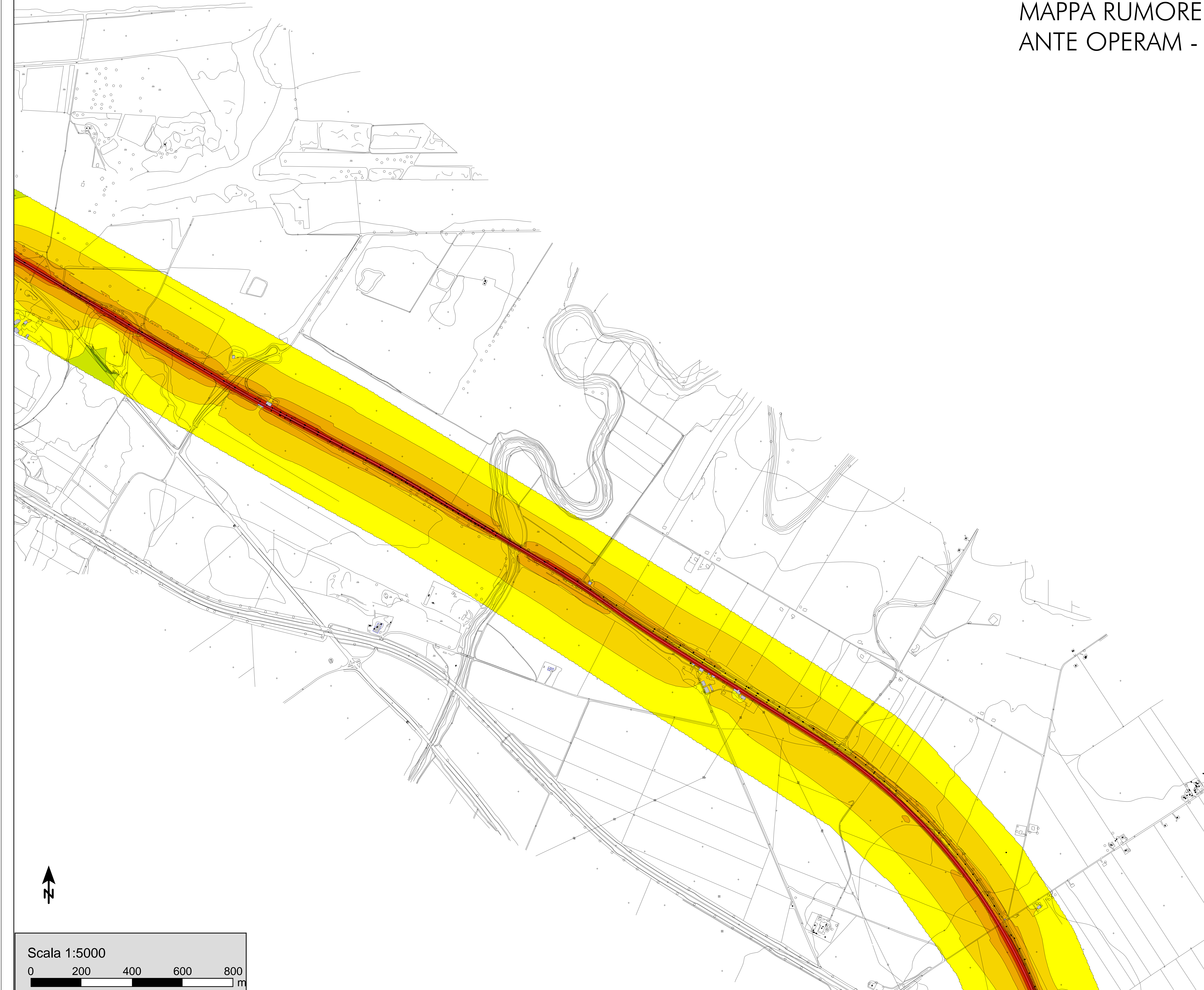
TAVOLA 1 - RIPALTA LESINA MAPPA RUMORE QUOTA h=4m ANTE OPERAM - PERIODO NOTTURNO