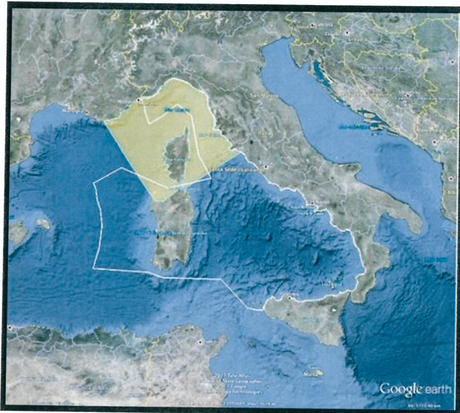
Zpe e Santuario Pelagos

- l'area oggetto del progetto è inquadrata, altresì, tra le zone di protezione ecologica ai sensi del D.P.R. 209 del 2011 che all'art. 3 chiaramente afferma. "Nella zona di protezione ecologica... si applicano le norme dell'ordinamento italiano, del diritto dell'Unione europea e delle Convenzioni internazionali in vigore, di cui l'Italia è parte contraente, in particolare, in materia di: a) prevenzione e repressione di tutti i tipi di inquinamento marino da navi, comprese le piattaforme off-shore... ".