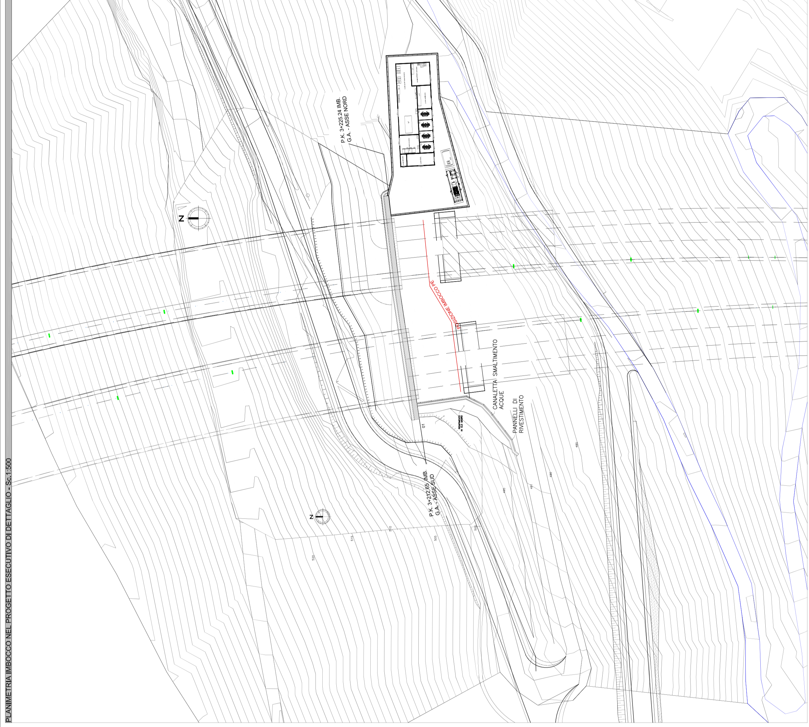
FOTONISERIMENTO IMBOCCO NEL PROGETTO ESECUTIVO DI DETTAGLIO