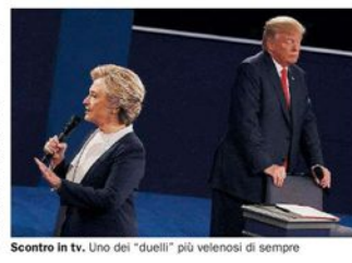
Scontro in tv. Uno dei "duelli" più velenosi di sempre