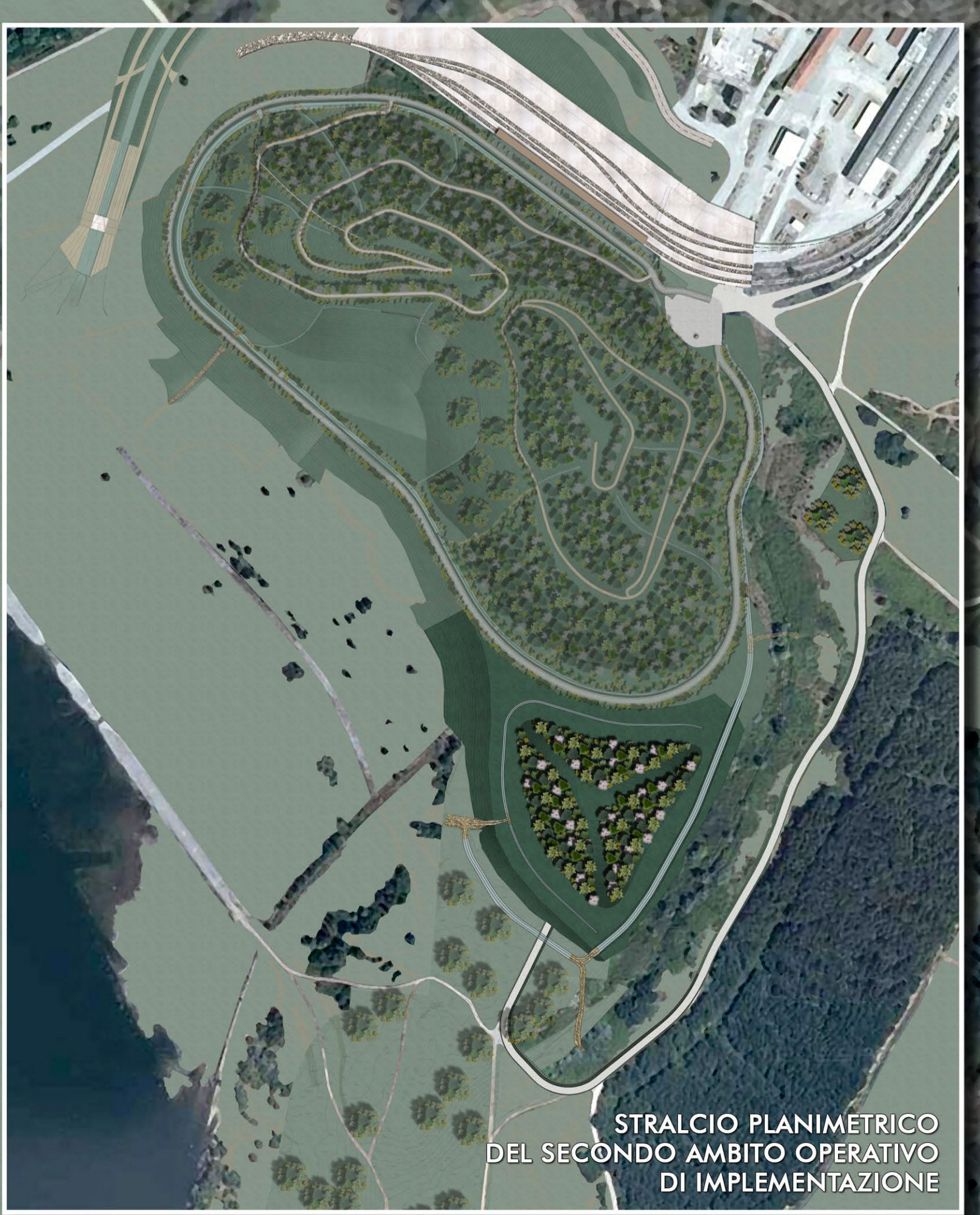
STRALCIO PLANIMETRICO DEL SECONDO AMBITO OPERATIVO DI IMPLEMENTAZIONE