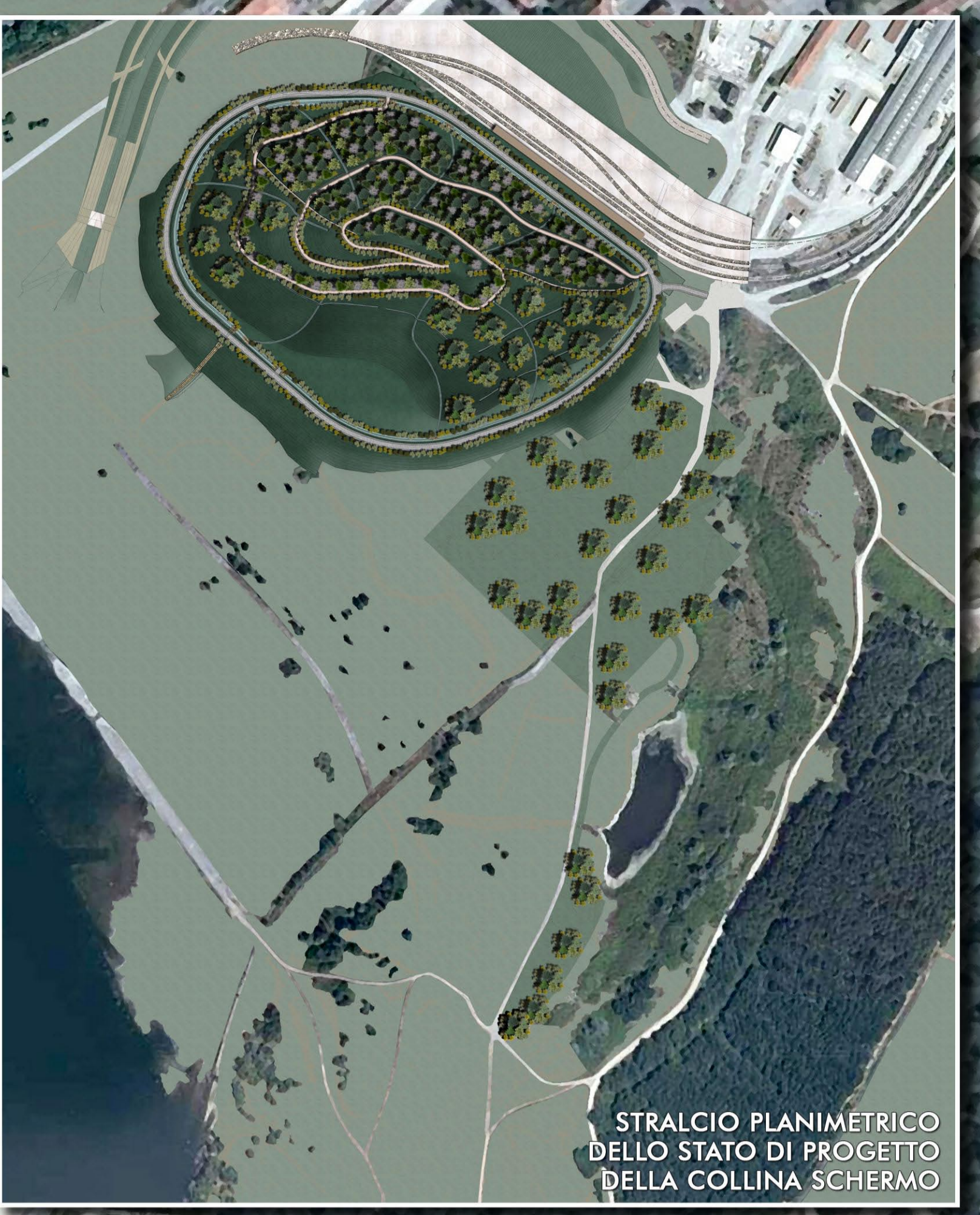
STRALCIO PLANIMETRICO DELLO STATO DI PROGETTO DELLA COLLINA SCHERMO