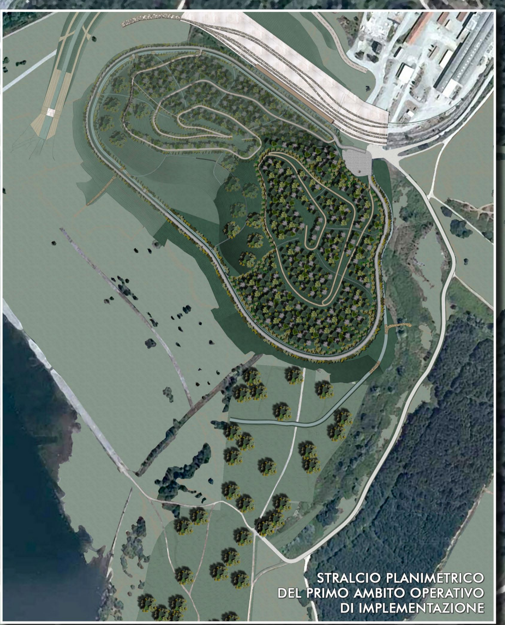
STRALCIO PLANIMETRICO DEL PRIMO AMBITO OPERATIVO DI IMPLEMENTAZIONE