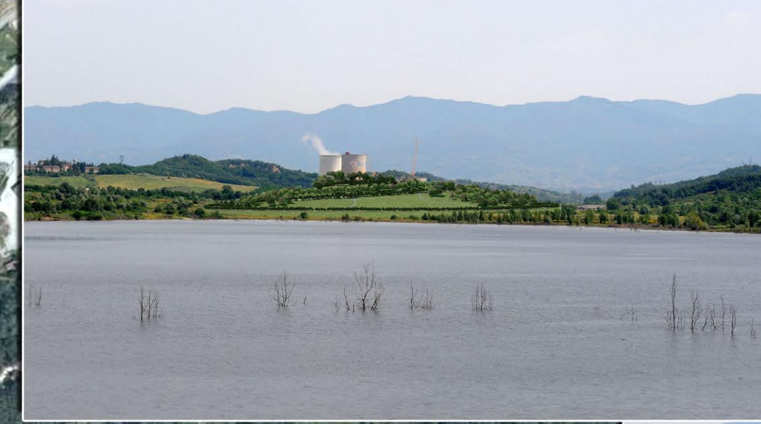
VISTA 3 - STATO DI PROGETTO DELLA COLLINA SCHERMO