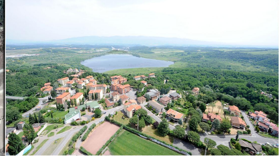
VISTA 1 - STATO DI PROGETTO DELLA COLLINA SCHERMO