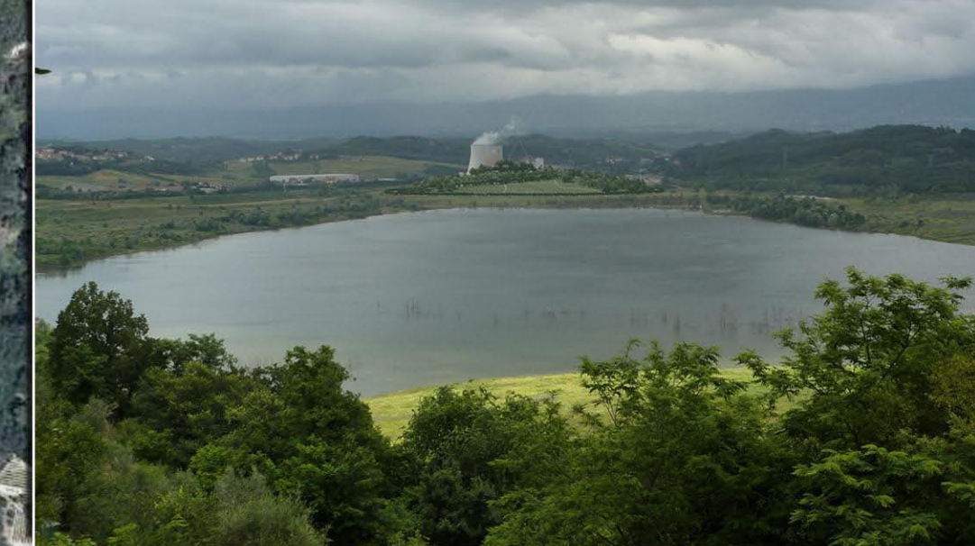
VISTA 2 - STATO DI PROGETTO DELLA COLLINA SCHERMO