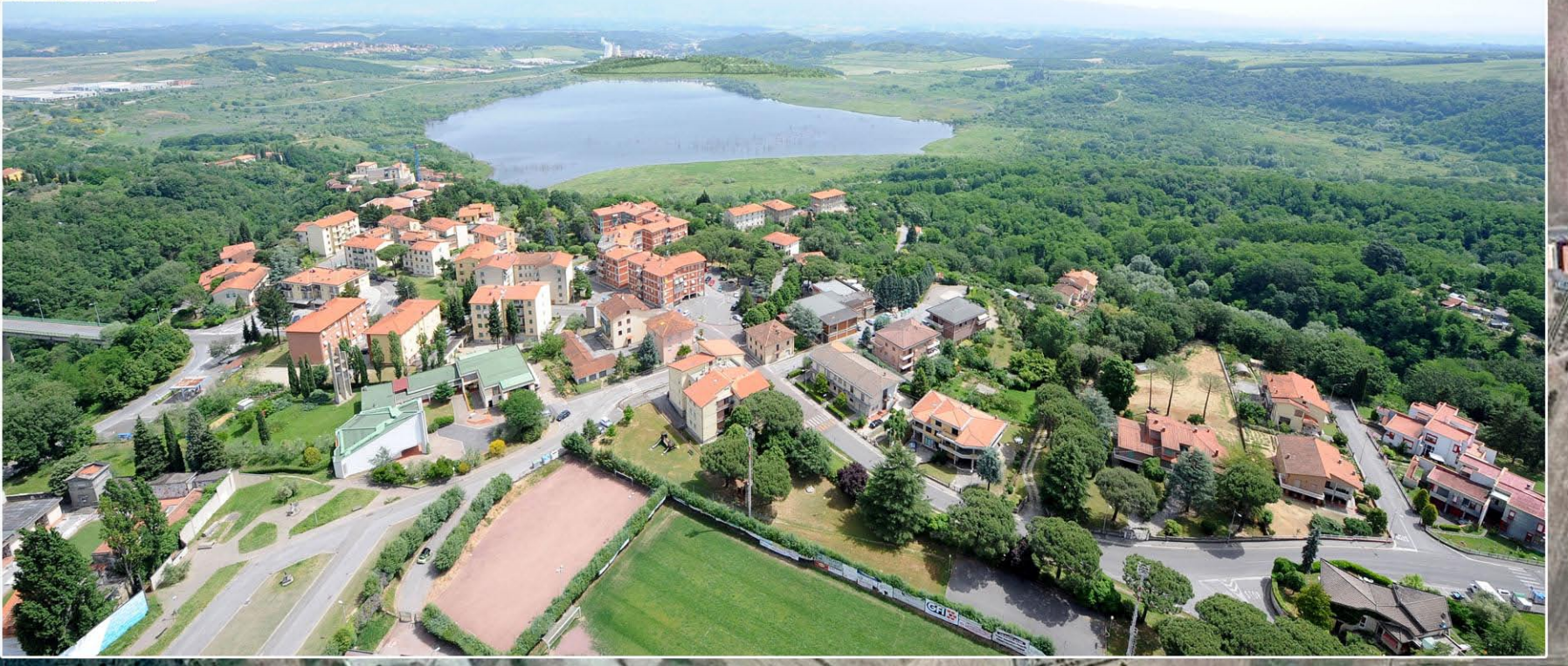
VISTA 1 - CONFIGURAZIONE FINALE DELLA COLLINA SCHERMO E DEGLI AMBITI OPERATIVI DI IMPLEMENTAZIONE