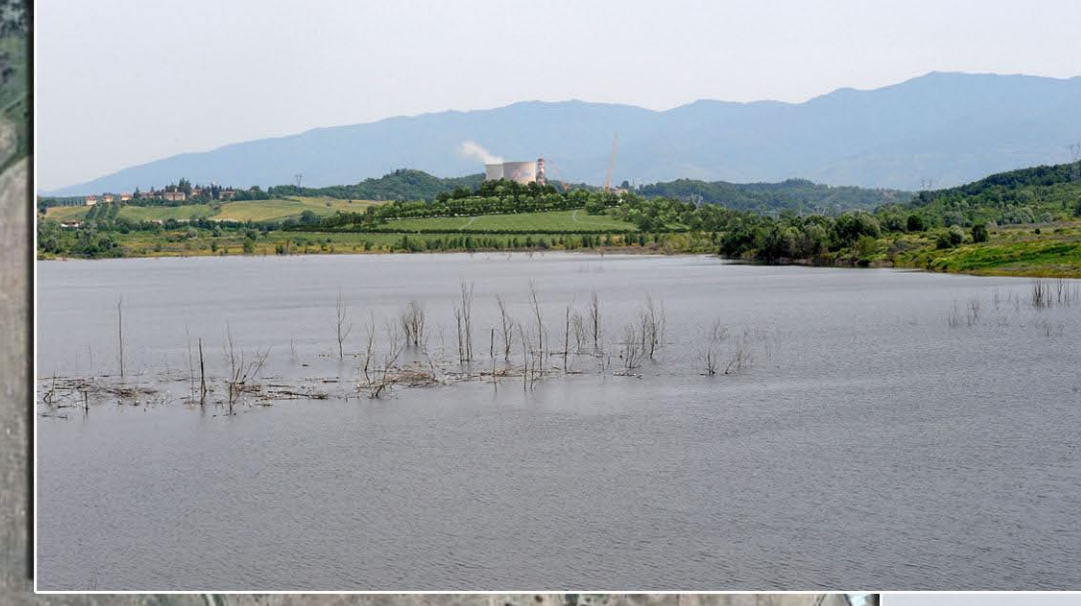
VISTA 4 - STATO DI PROGETTO DELLA COLLINA SCHERMO