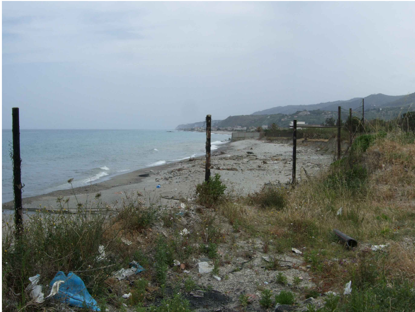
STATO ATTUALE VISTA 1