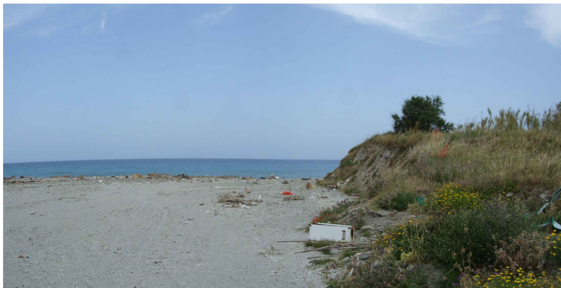
STATO ATTUALE VISTA 2