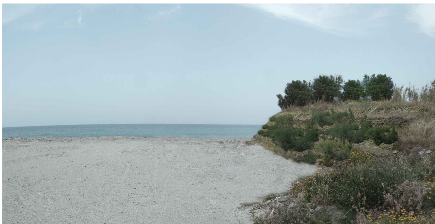
SIMULAZIONE VISTA 2