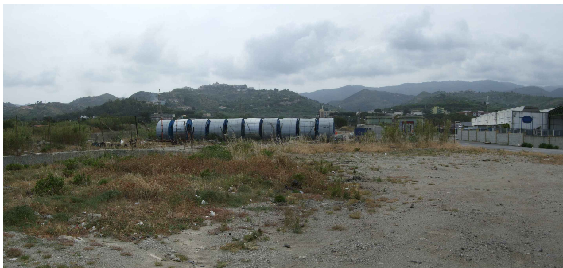
STATO ATTUALE VISTA 3