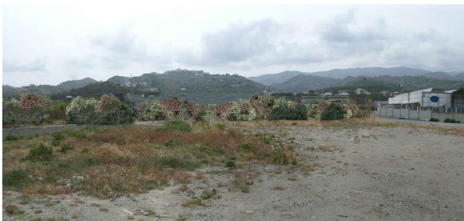
SIMULAZIONE VISTA 3