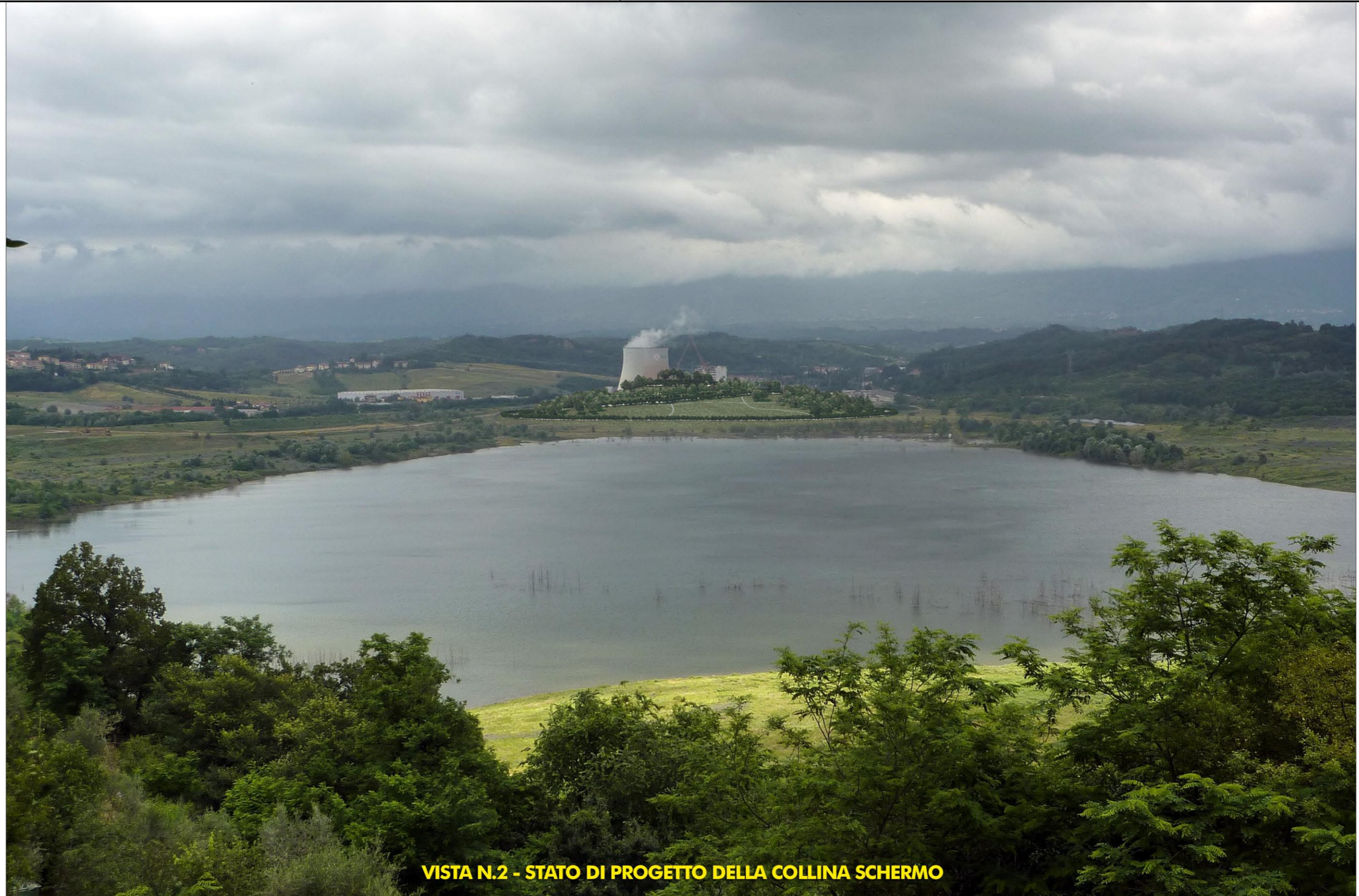
VISTA N.2 - STATO DI PROGETTO DELLA COLLINA SCHERMO