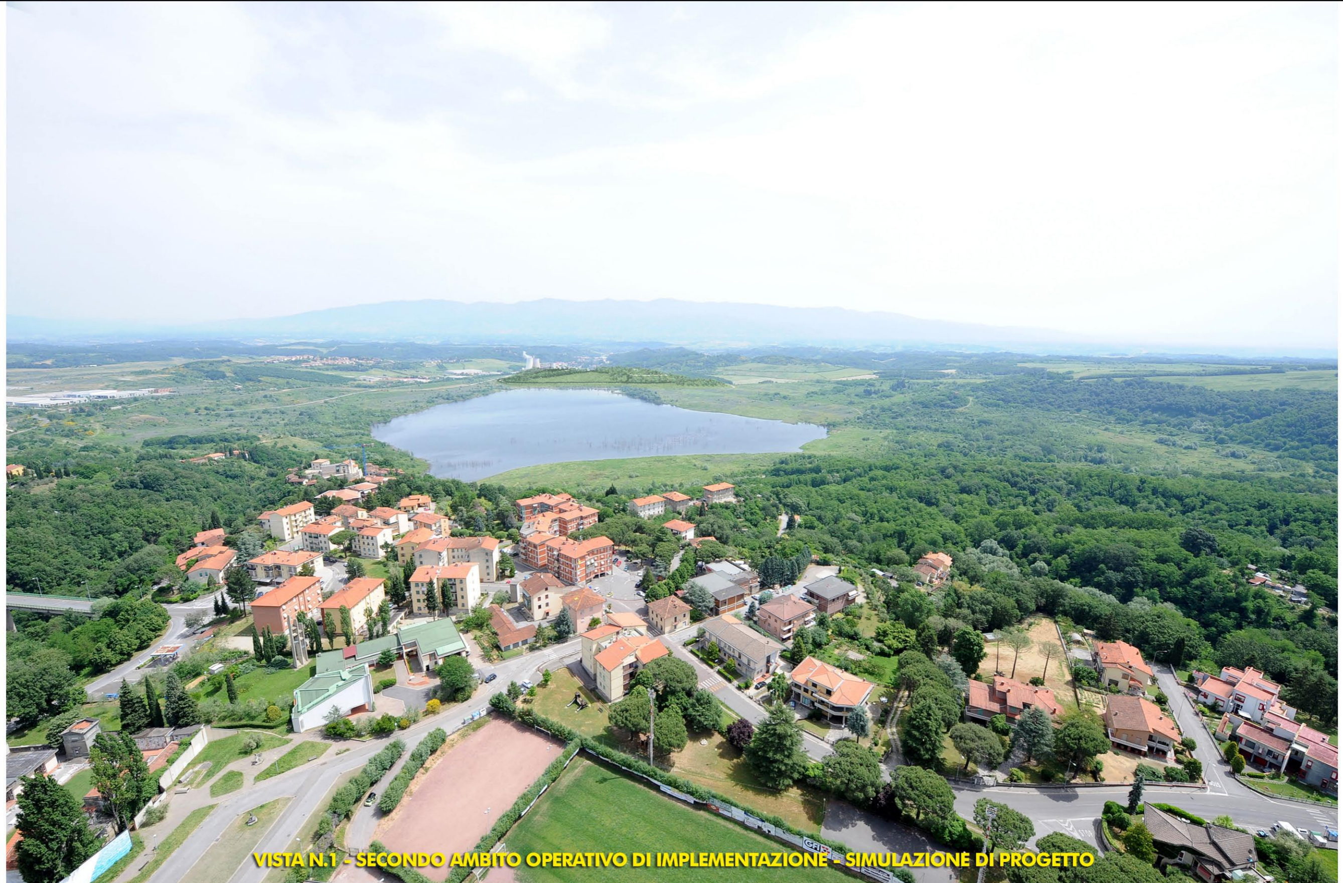
VISTA N.1 - SECONDO AMBITO OPERATIVO DI IMPLEMENTAZIONE - SIMULAZIONE DI PROGETTO