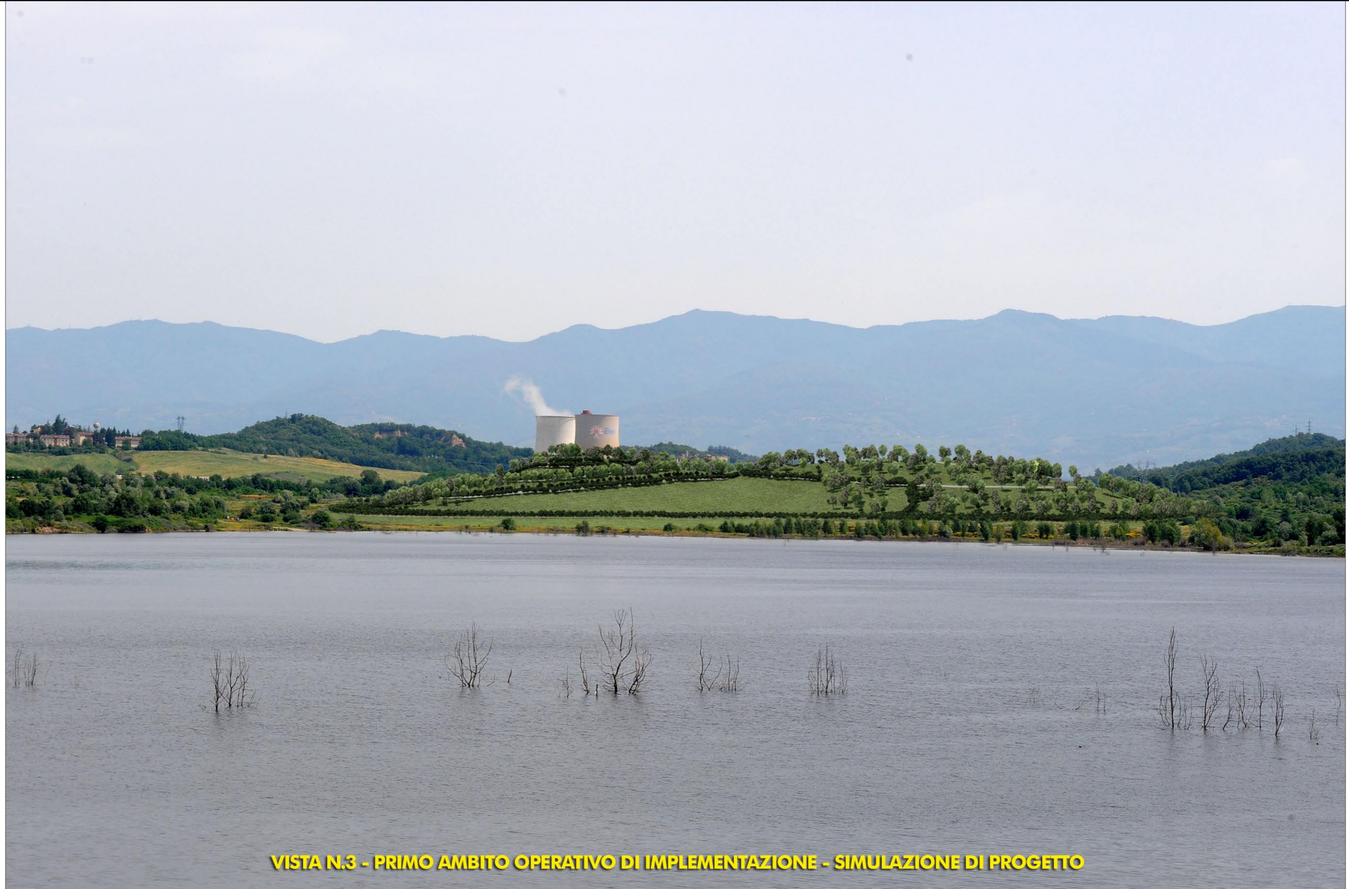
VISTA N.3 - PRIMO AMBITO OPERATIVO DI IMPLEMENTAZIONE - SIMULAZIONE DI PROGETTO