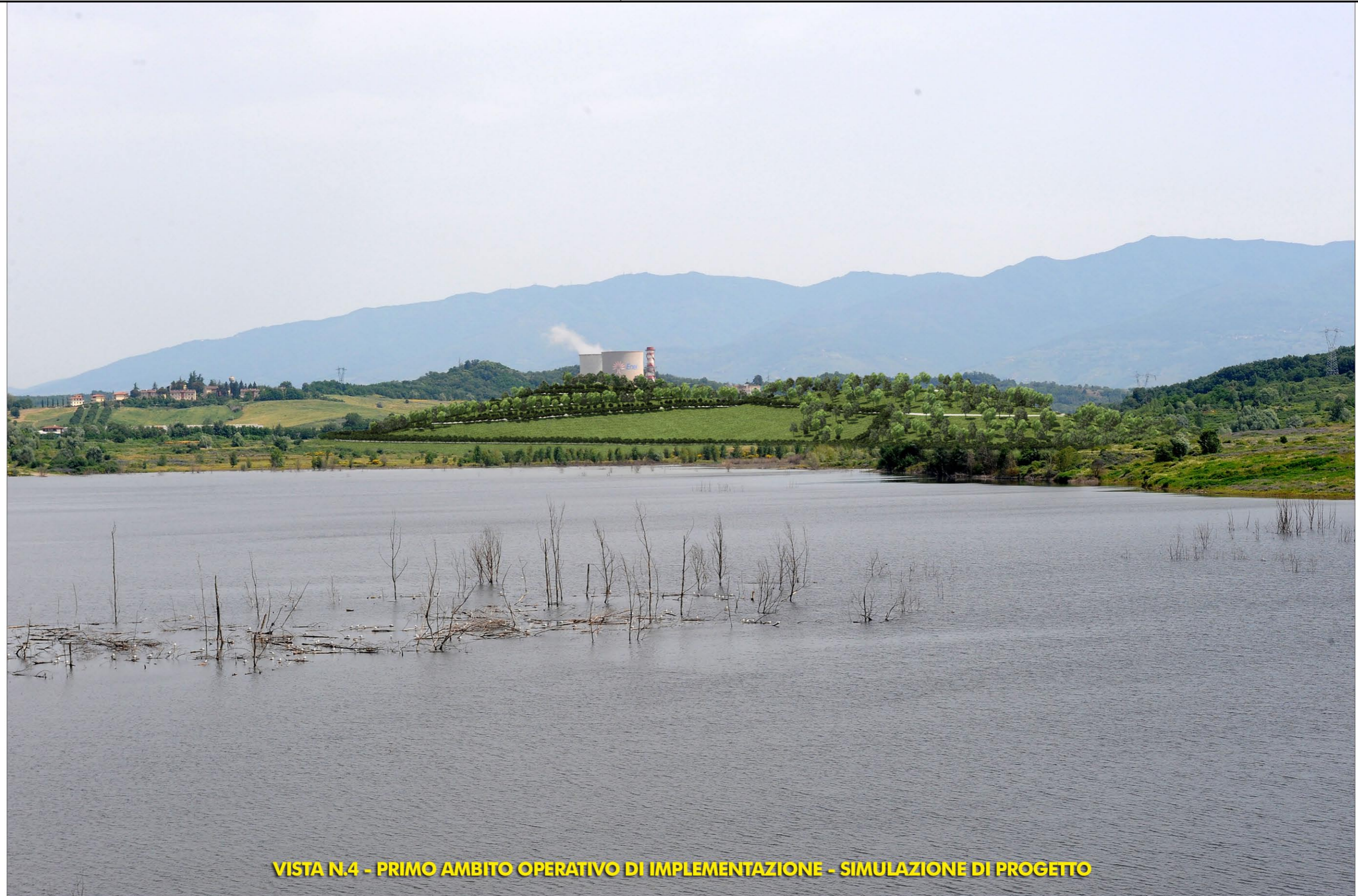
VISTA N.4 - PRIMO AMBITO OPERATIVO DI IMPLEMENTAZIONE - SIMULAZIONE DI PROGETTO