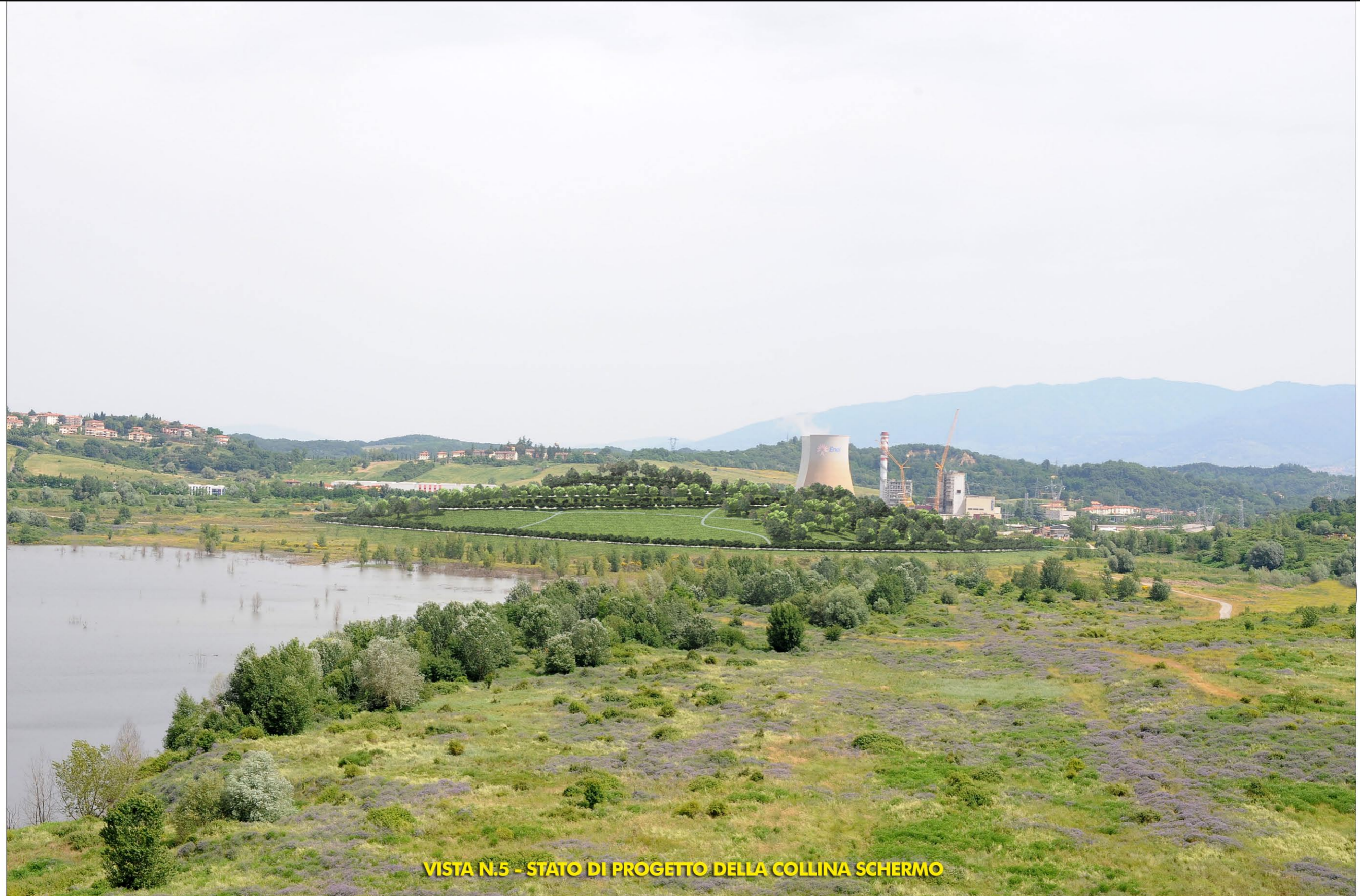
VISTA N.5 - STATO DI PROGETTO DELLA COLLINA SCHERMO