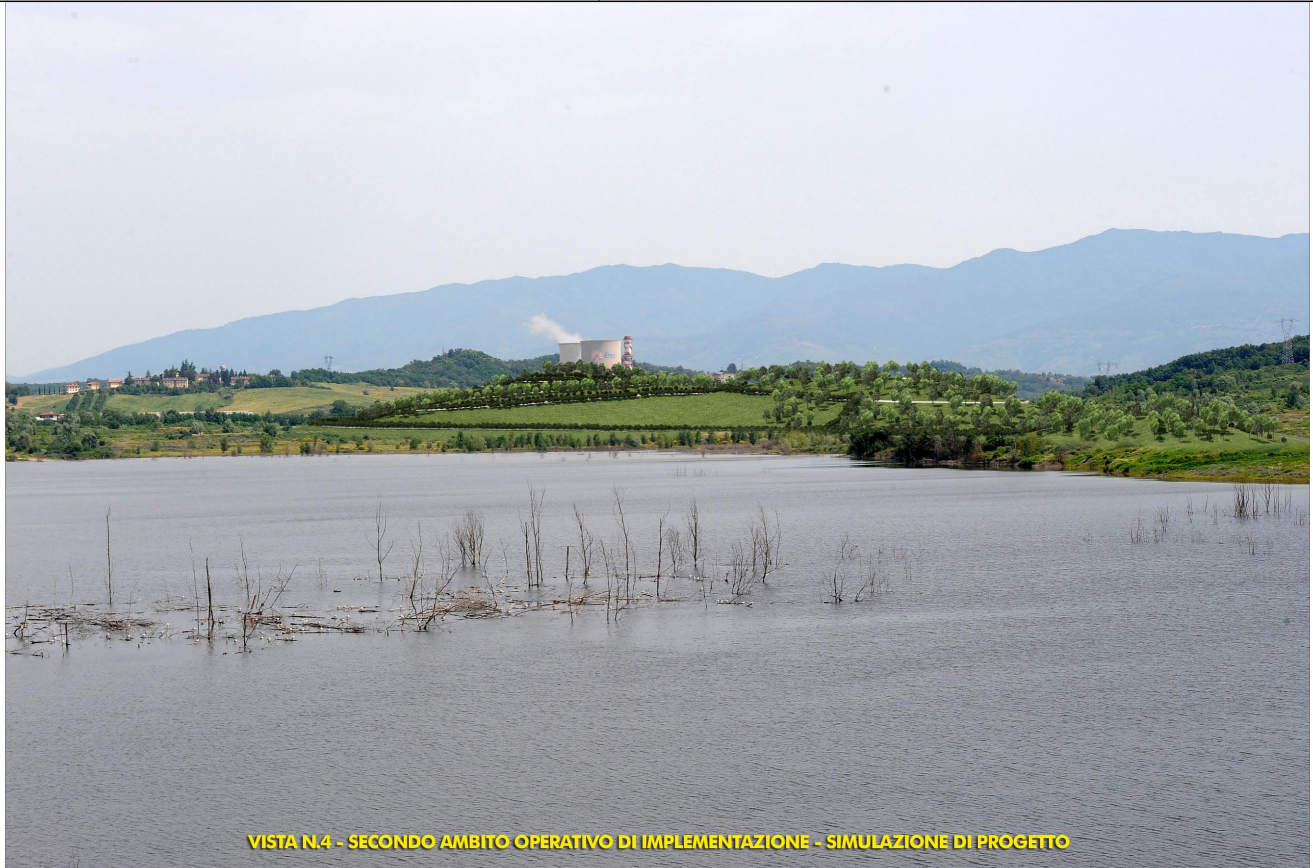
VISTA N.4 - SECONDO AMBITO OPERATIVO DI IMPLEMENTAZIONE - SIMULAZIONE DI PROGETTO