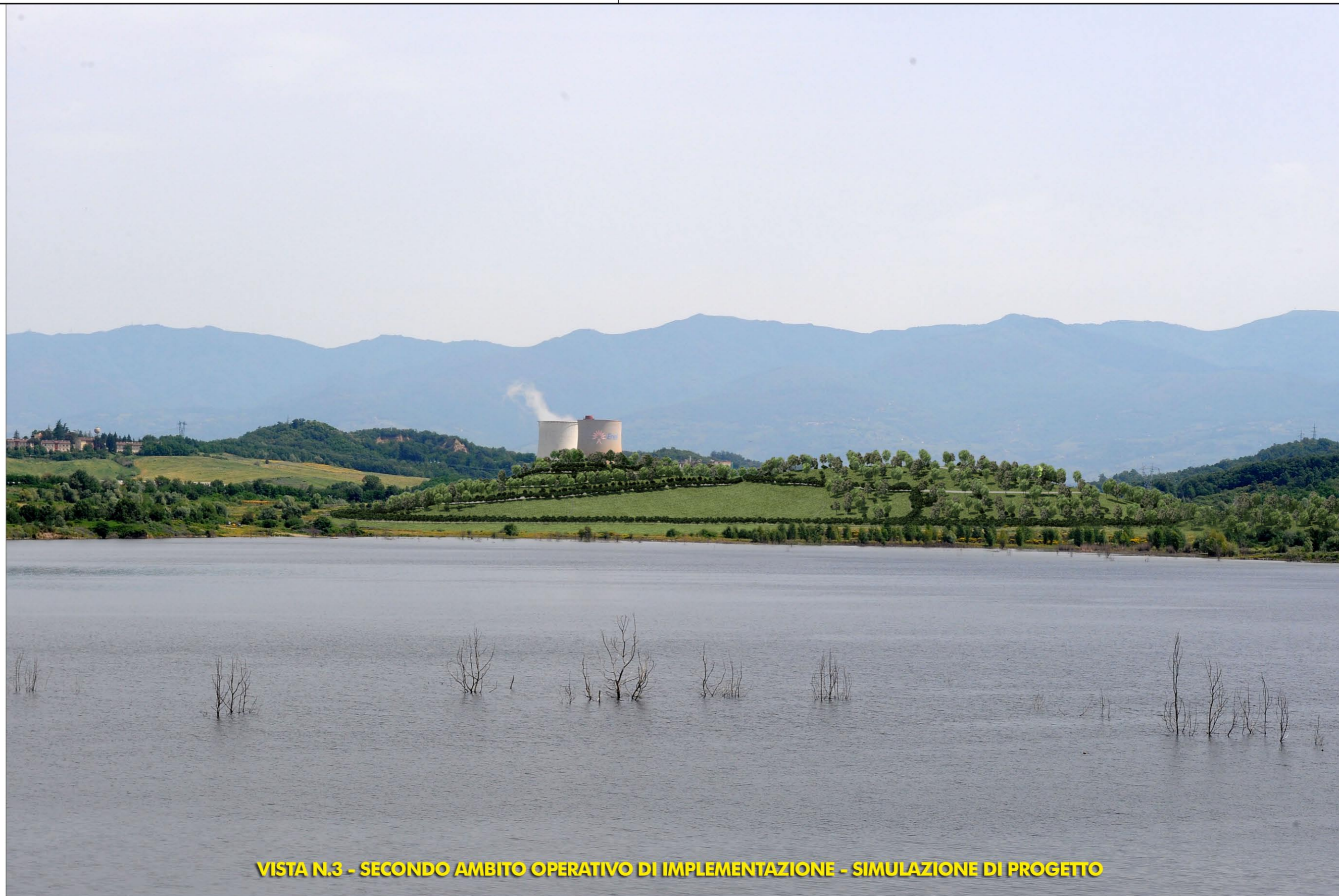
VISTA N.3 - SECONDO AMBITO OPERATIVO DI IMPLEMENTAZIONE - SIMULAZIONE DI PROGETTO