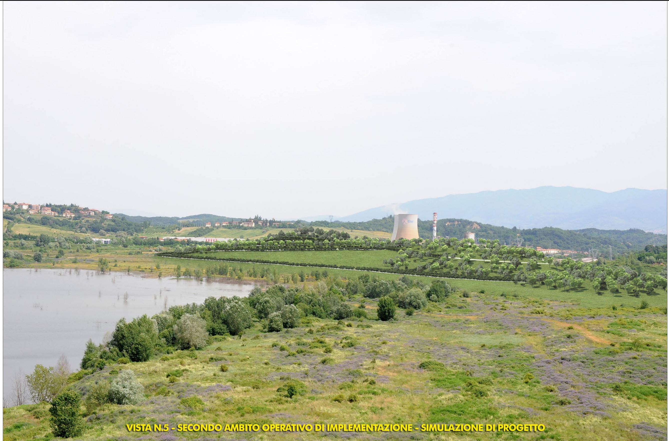
VISTA N.5 - SECONDO AMBITO OPERATIVO DI IMPLEMENTAZIONE - SIMULAZIONE DI PROGETTO