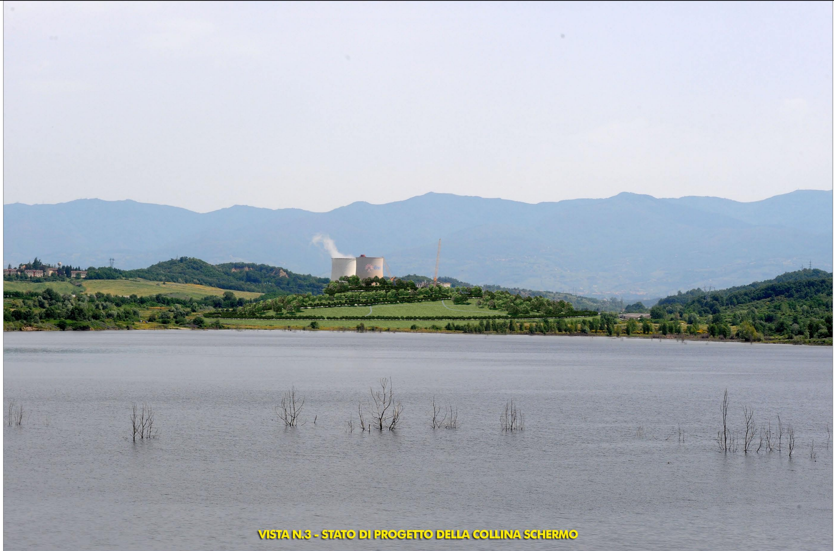
VISTA N.3 - STATO DI PROGETTO DELLA COLLINA SCHERMO