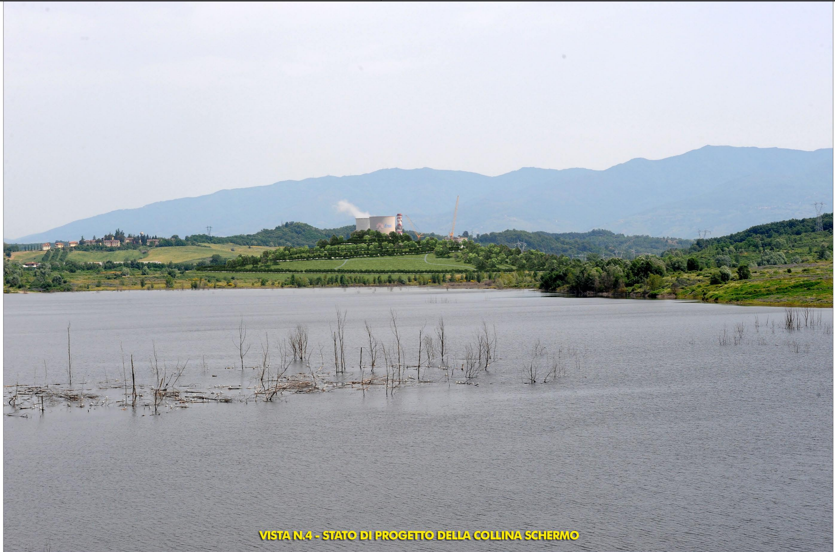
VISTA N.4 - STATO DI PROGETTO DELLA COLLINA SCHERMO