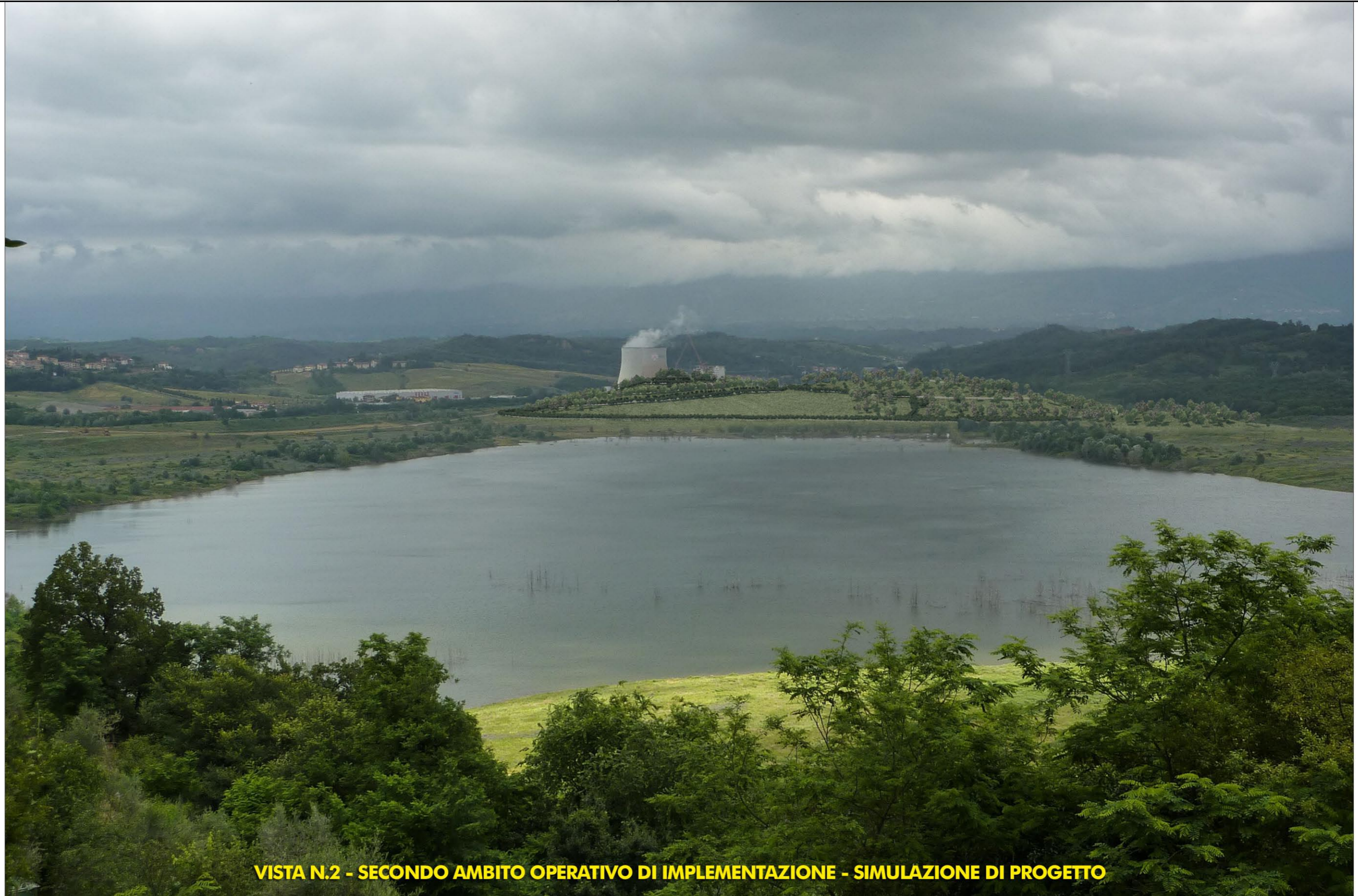
VISTA N.2 - SECONDO AMBITO OPERATIVO DI IMPLEMENTAZIONE - SIMULAZIONE DI PROGETTO