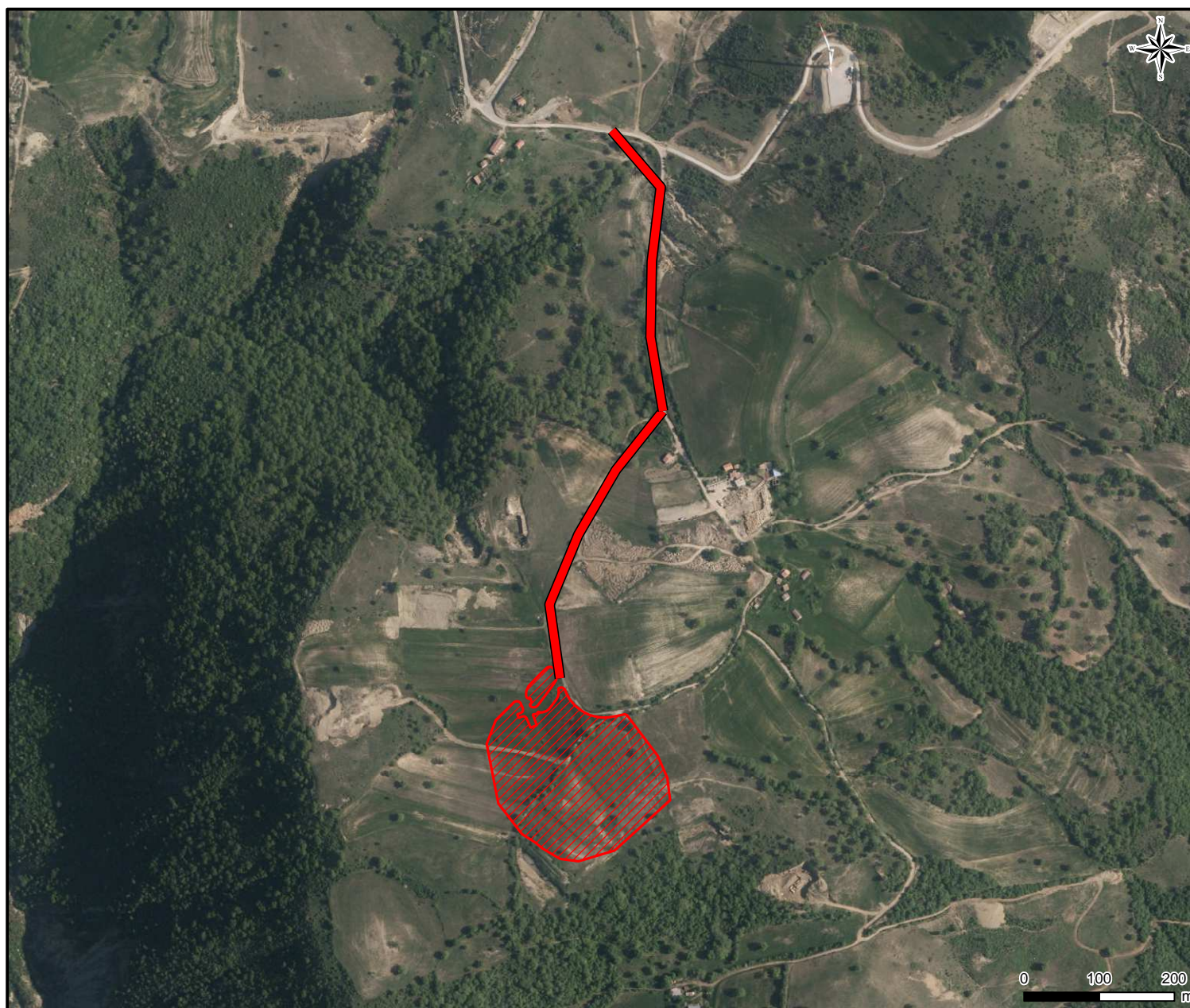
Figura 2.a Identificazione area cantiere pozzo GG3 ai fini della valutazione delle emissioni polverulente durante la fase di cantiere