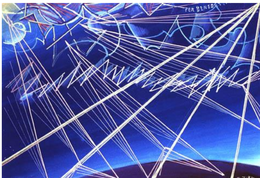
GIACOMO BALLA (1871-1958) TRASFORMAZIONE DI FORME 1918