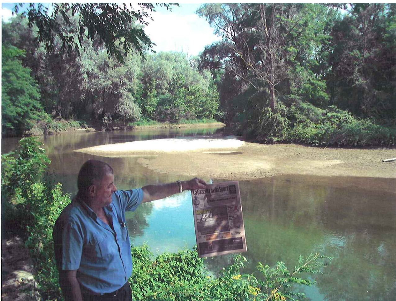
L'incile, a monte, della Marchionale di Gattinara con il ramo destro del Sesia fortemente deficitario