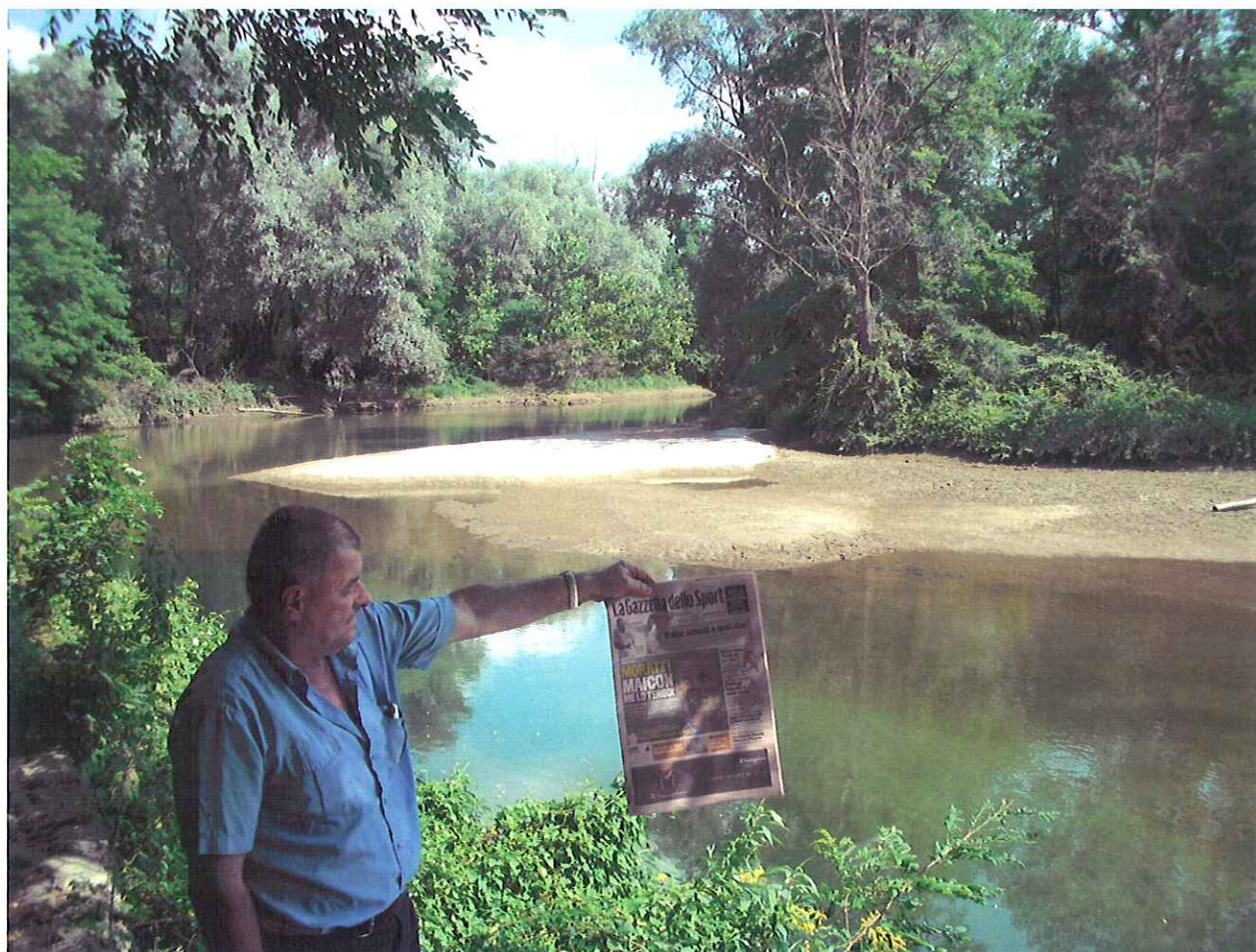
L'incile, a monte, della Marchionale di Gattinara con il ramo destro del Sesia fortemente deficitario