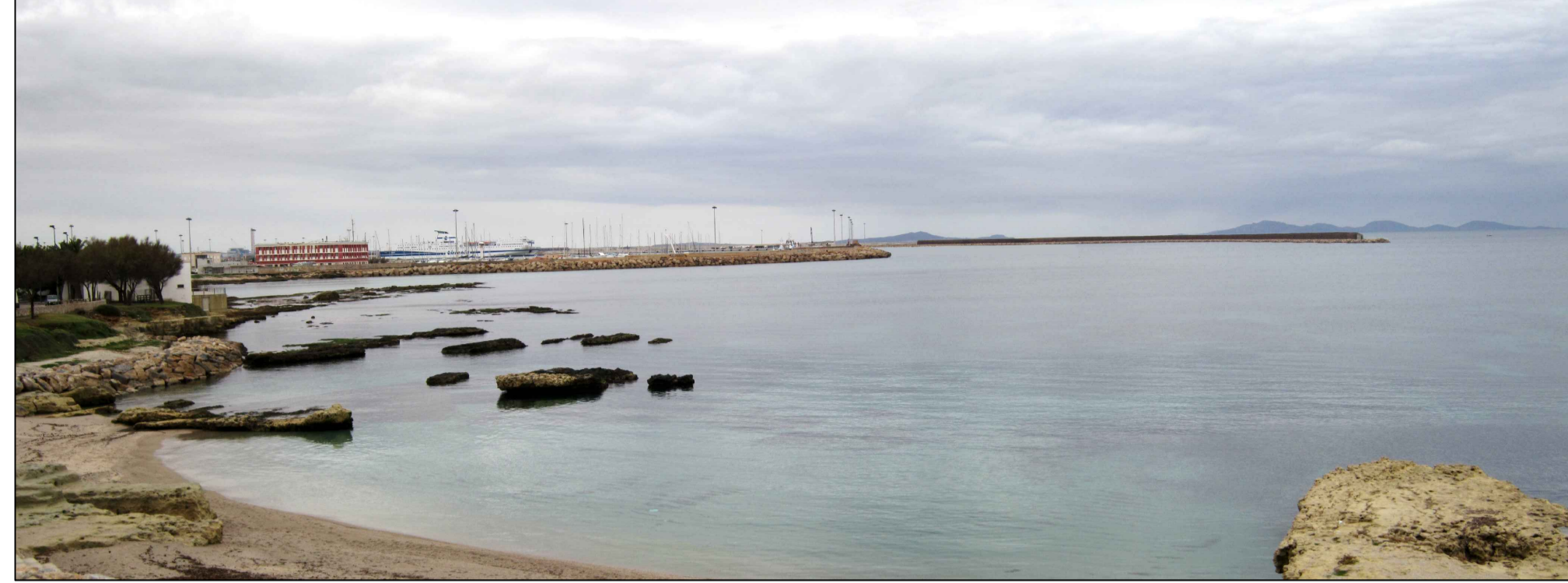
Simulazione d'inserimento visuale n° 2