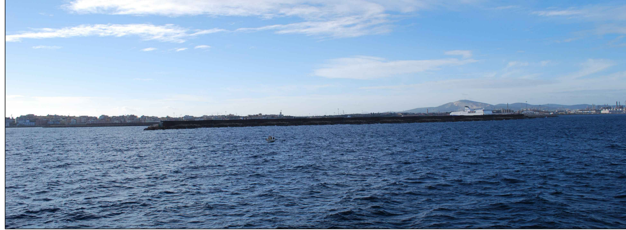
Simulazione d'inserimento visuale n° 1