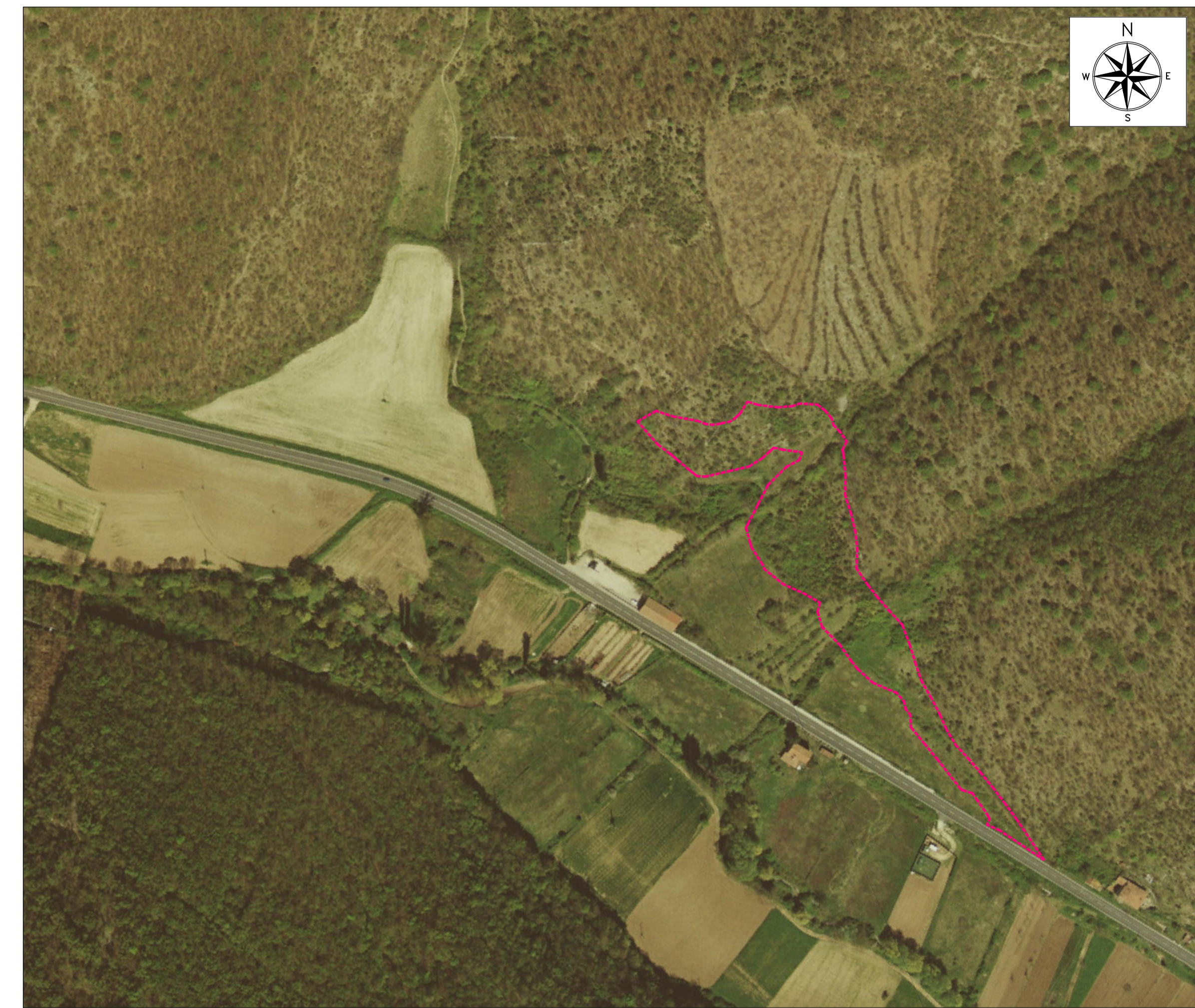
ORTOFOTO DI INQUADRAMENTO - SCALA 1:2000