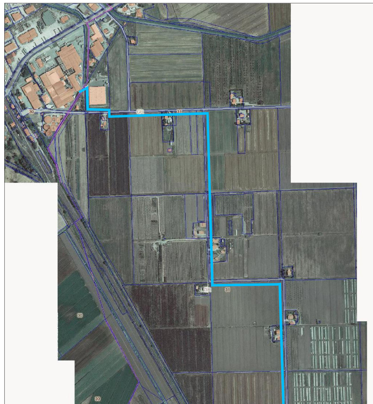
Estratto di foto aerea con indicazione tracciato