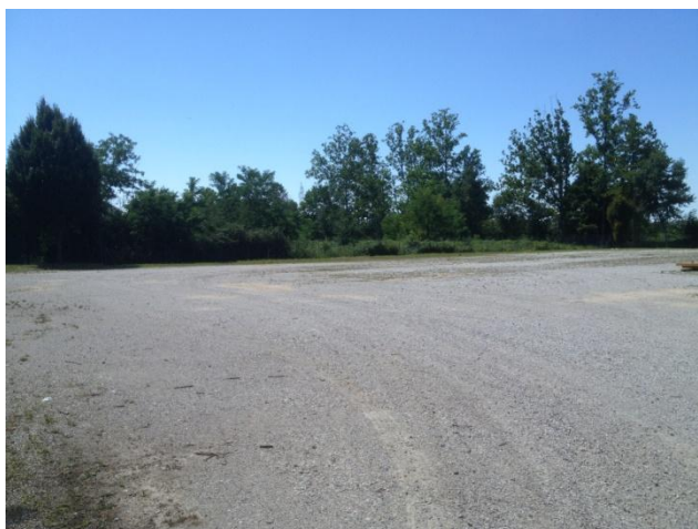
Figura 2 – Piazzale deposito materiale