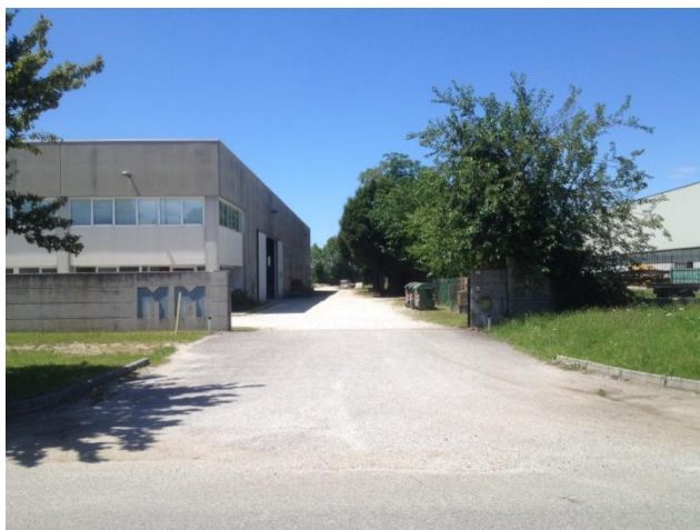
Figura 1 – Ingresso capannone, zona ufficio

L'area scoperta verrà adibita a deposito materiali, macchinari ed attrezzature di lavoro ingombranti e grossolane, mentre nell'area coperta è previsto lo stoccaggio di materiale minuto e della restante attrezzatura, nonché l'esecuzione di lavorazioni propedeutiche all'installazione (ad esempio l'assemblaggio dei cestelli di fondazione) in caso di cattive condizioni atmosferiche. Presso entrambe le aree verranno svolte attività di carico/scarico e movimentazione tramite autocarro/autogru/carrello elevatore. Gli uffici sono dislocati nell'area coperta.