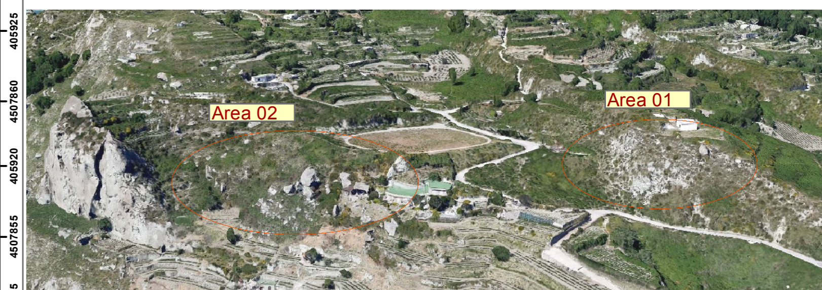
Ubicazione della zona d'indagine su vista dall'alto