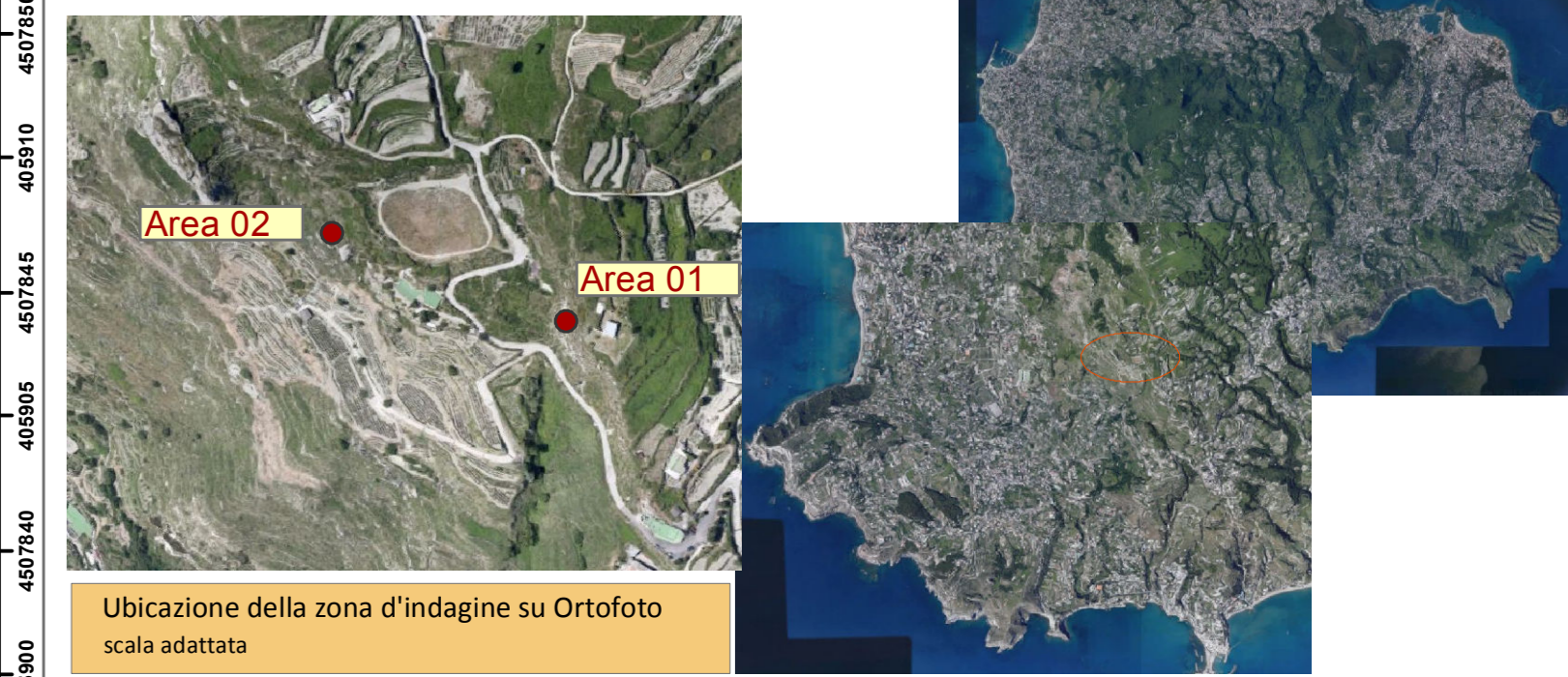
Ubicazione della zona d'indagine su Ortofoto scala adattata