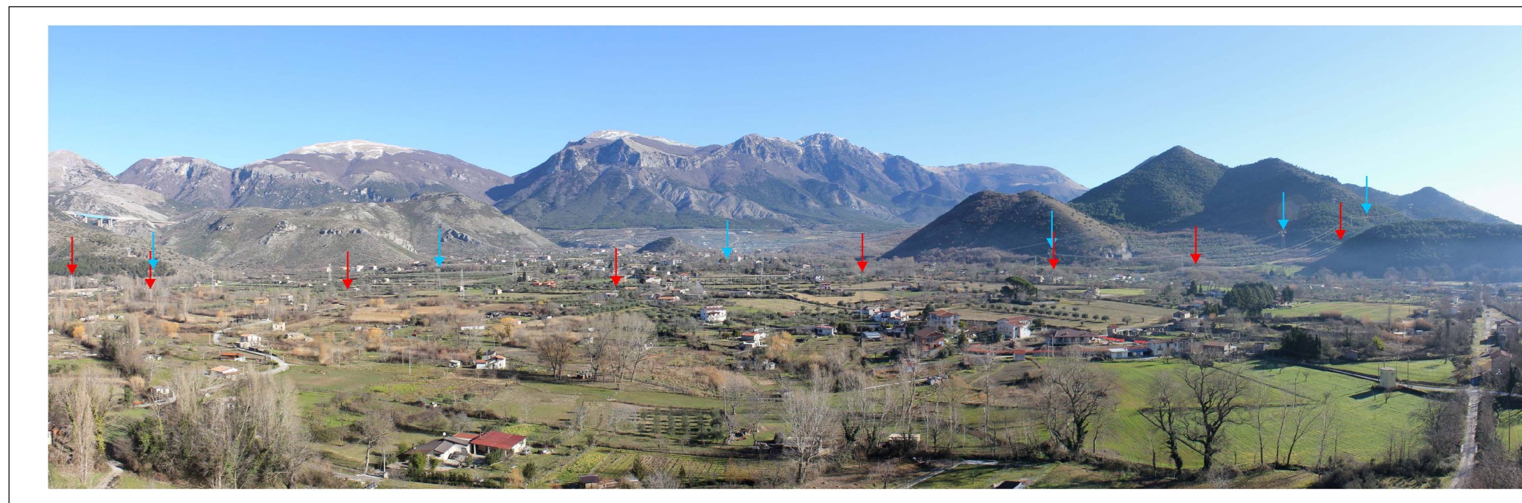
Stato di fatto (→ Demolizioni) (← Manutenzioni)