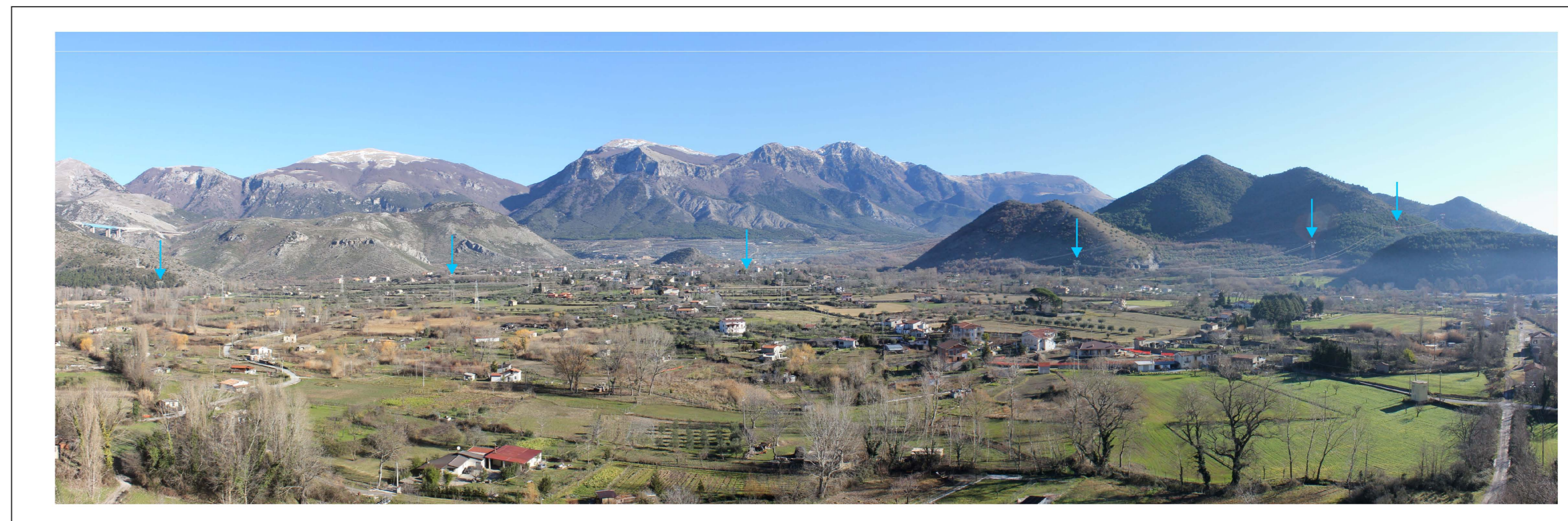
Stato di progetto (←→ Manutenzioni)