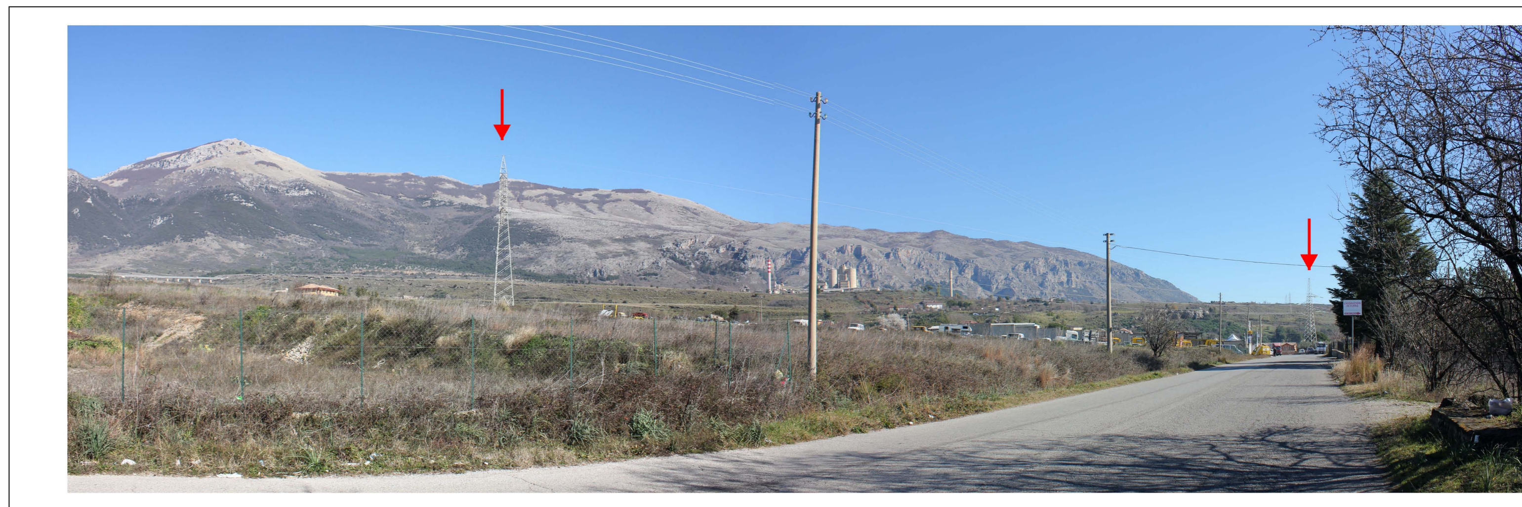
Stato di fatto (→ Demolizioni)