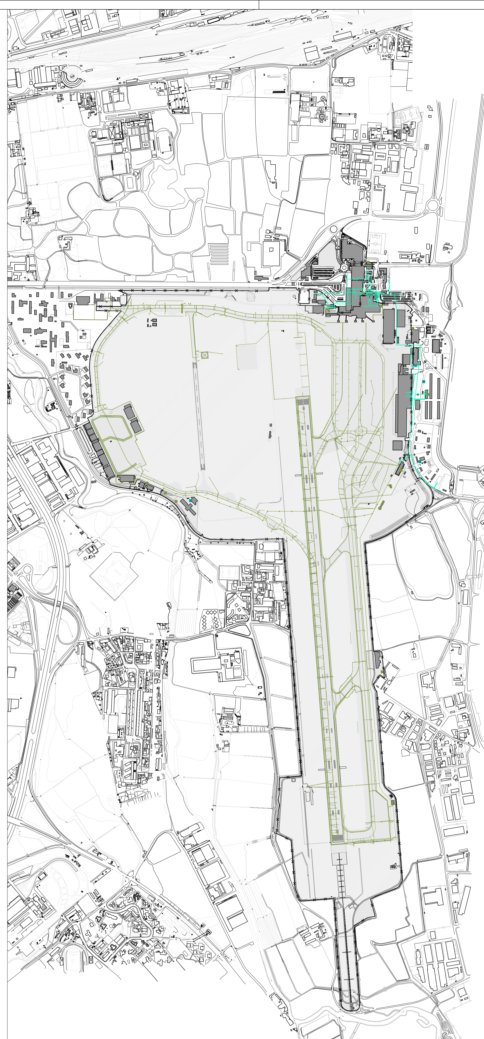
02 Sottoservizi - rete elettrica 1:10.000