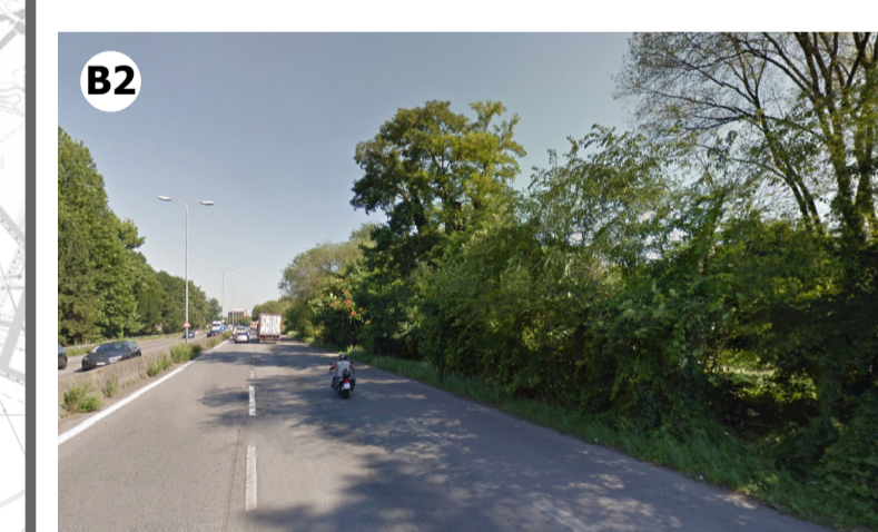
Condizione percettiva impossibile (V3) in ragione della presenza di vegetazione arborea che limita la visibilità verso l'aeroporto e la distanza intercorrente tra questo e l'ambito di visuale