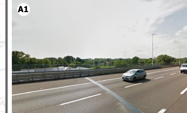
Condizione percettiva impossibile (V3) in ragione della presenza di vegetazione arborea che limita la visibilità verso l'aeroporto e la distanza intercorrente tra questo e l'ambito di visuale