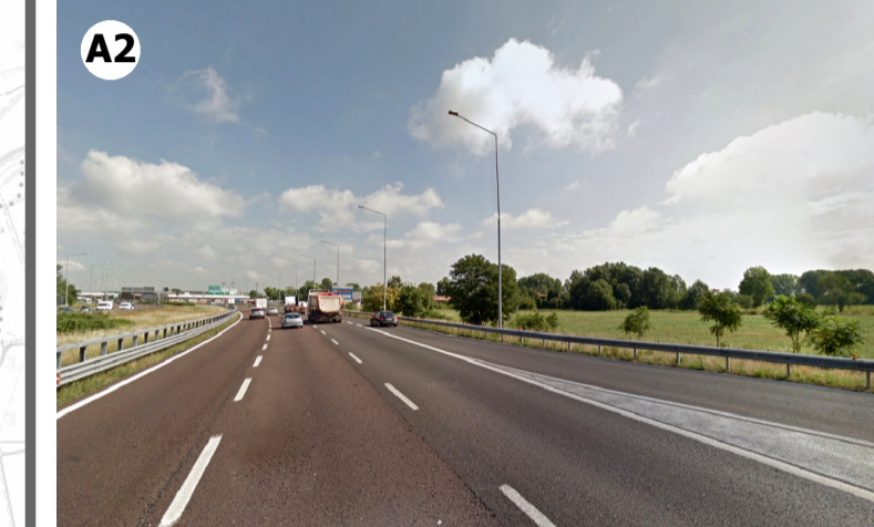
Condizione percettiva impossibile (V3) in ragione della presenza di vegetazione arborea che limita la visibilità verso l'aeroporto e la distanza intercorrente tra questo e l'ambito di visuale