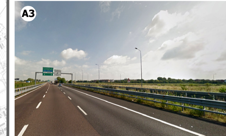
Condizione percettiva impossibile (V3) in ragione della presenza di vegetazione arborea che limita la visibilità verso l'aeroporto e la distanza intercorrente tra questo e l'ambito di visuale