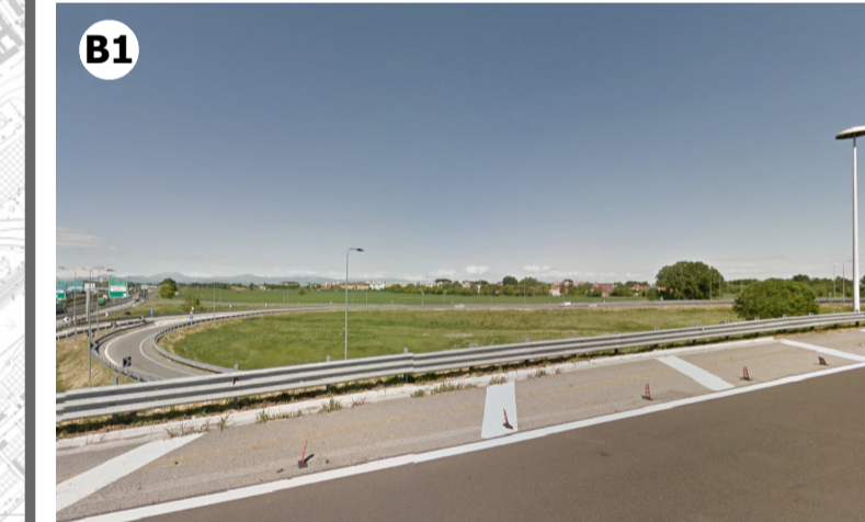
Condizione percettiva impossibile (V3) in ragione della distanza intercorrente tra l'ambito e l'infrastruttura aeroportuale