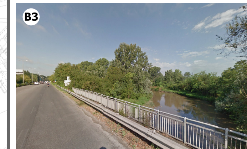
Condizione percettiva impossibile (V3) in ragione della presenza di vegetazione arborea che limita la visibilità verso l'aeroporto e la distanza intercorrente tra questo e l'ambito di visuale