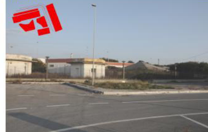
Tipologia 4 ante