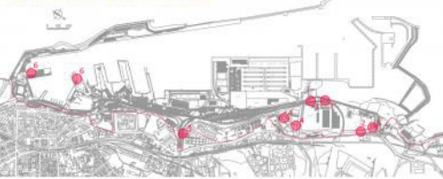
Keyplan - Localizzazione Interventi "tipo"