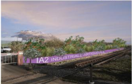
juncus effusus L. arbutus unedo L. cistus monspeliensis L. post