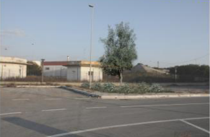
convolvulus cneorum L. pistacia lentiscus L. myrtus communis L. quercus suber L. post