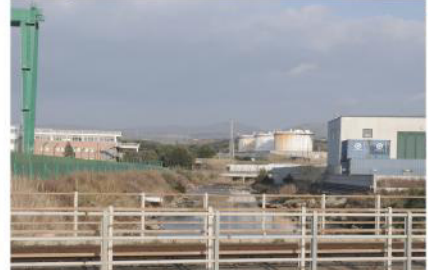
Tipologia 3 ante