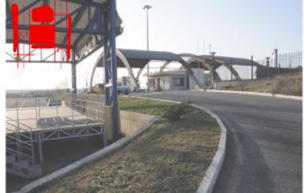
Tipologia 5 ante