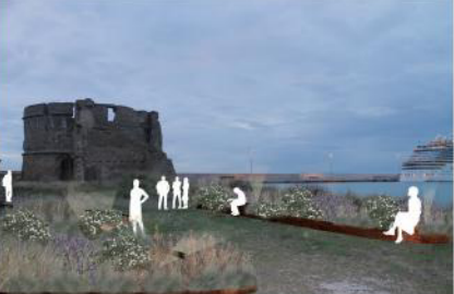
lavanda officinalis L. cistus monspeliensis L. festuca glauca L. post