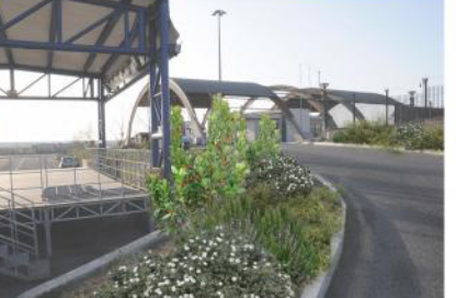
corchis siliquastrum L. lavanda officinalis L. alchorum italicum L. rosmarinus officinalis L. post