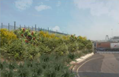
rosmarinus officinalis prostratus L. myrtus communis L. salsodulcis L. pistacia lentiscus L. post