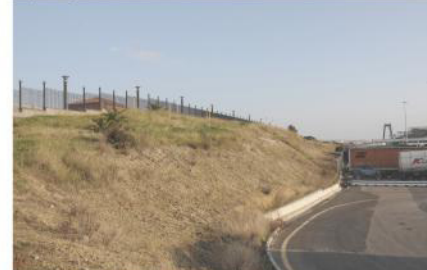
Tipologia 2 ante