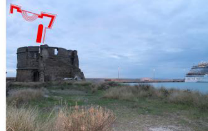
Tipologia 6 ante