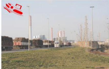
Tipologia 1 ante