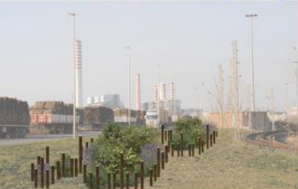
myrtus communis L. salsodulcis L. rosmarinus officinalis L. post