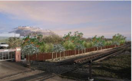
myrtus communis L. arbutus unedo L. cistus monspeliensis L. post