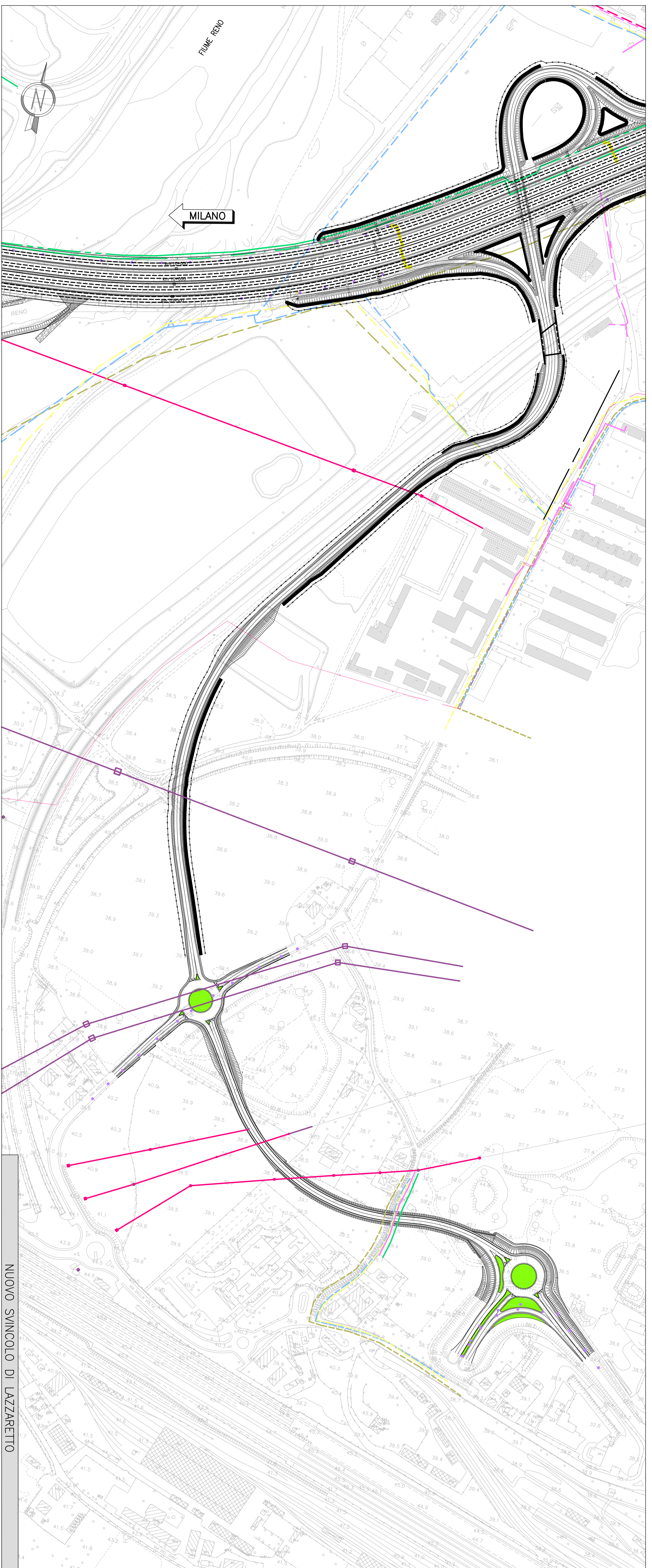
NUOVO SINCOLO DI LAZZARETTO