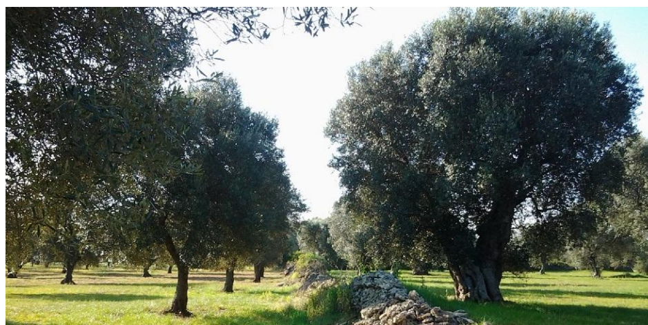
Figura 1 – Esempio presenza in una stessa area di ulivi di diversa tipologia