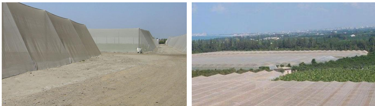
Figura 4 – Esempi di reti antinsetto per la protezione delle piante