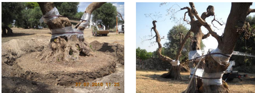
Figura 2 – Esempi preparazione buca per espianto e protezione branche per il trasporto

Per la predisposizione dei siti di conservazione temporanea del materiale vegetale soggetto ad espianto sarà necessario attuare misure utili per la preparazione dei terreni di destinazione, per l’allestimento delle trincee di stoccaggio e idonee modalità irrigue. Ciò sarà articolato come segue: