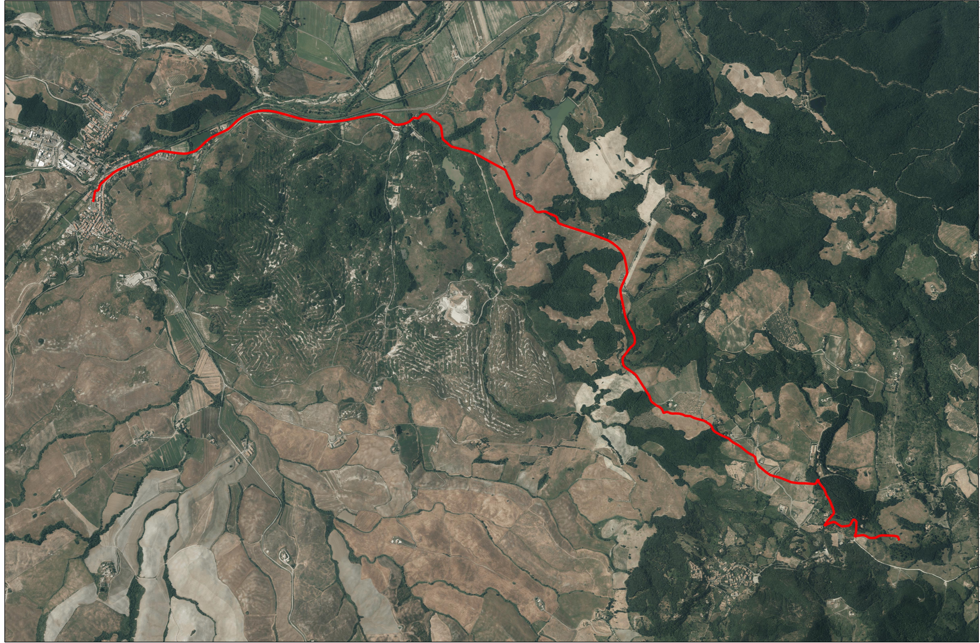
TRACCIATO SU ORTOFOTO 1:20000

PERMESSO DI RICERCA DI RISORSE GEOTERMICHE FINALIZZATO ALLA SPERIMENTAZIONE DI UN IMPIANTO PILOTA CONVENZIONALMENTE DENOMINATO "CORTOLLA" COMUNE DI MONTECATINI VAL DI CECINA - PROVINCIA DI PISA