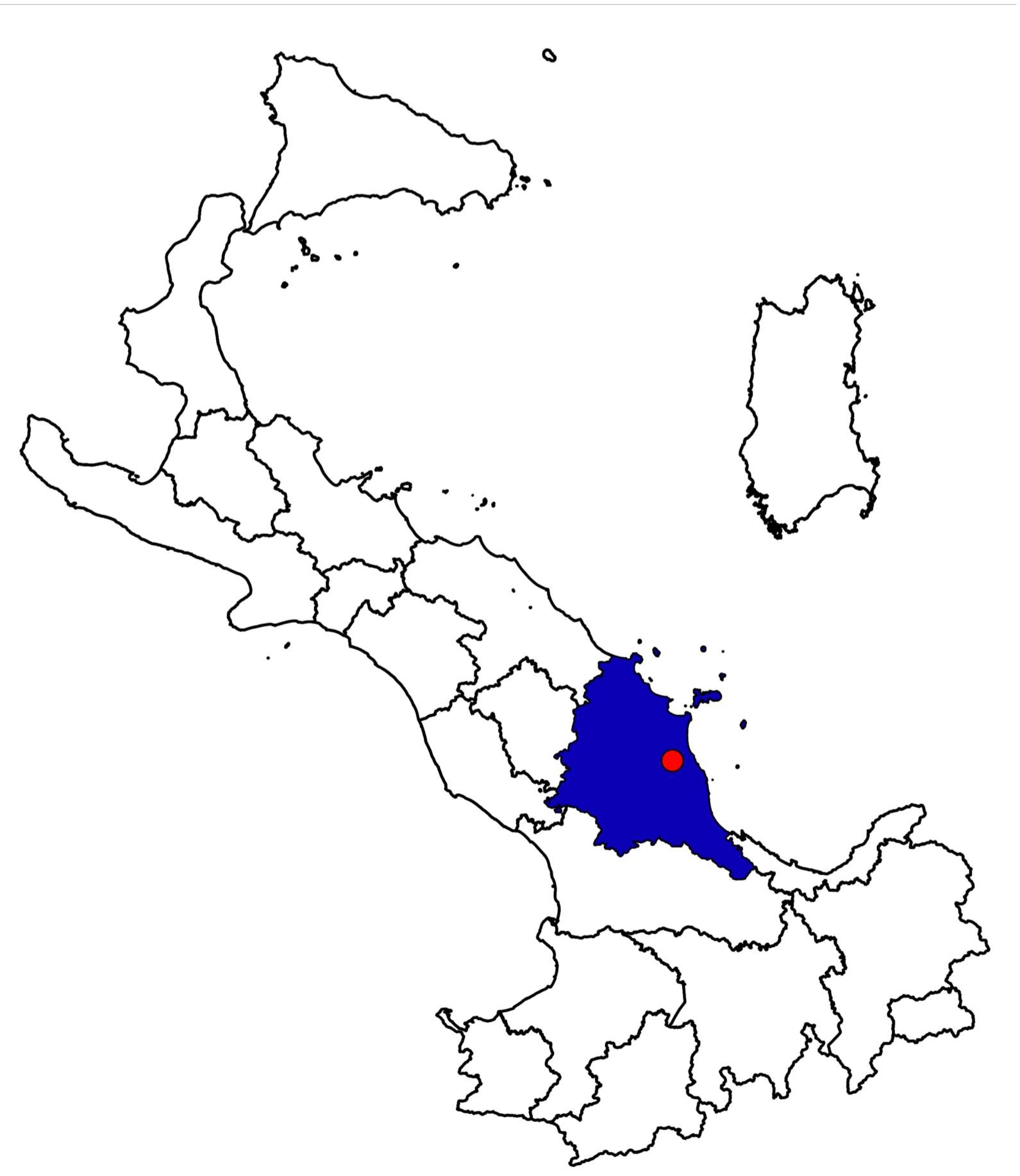
COROGRAFIA - Scala 1:250'000