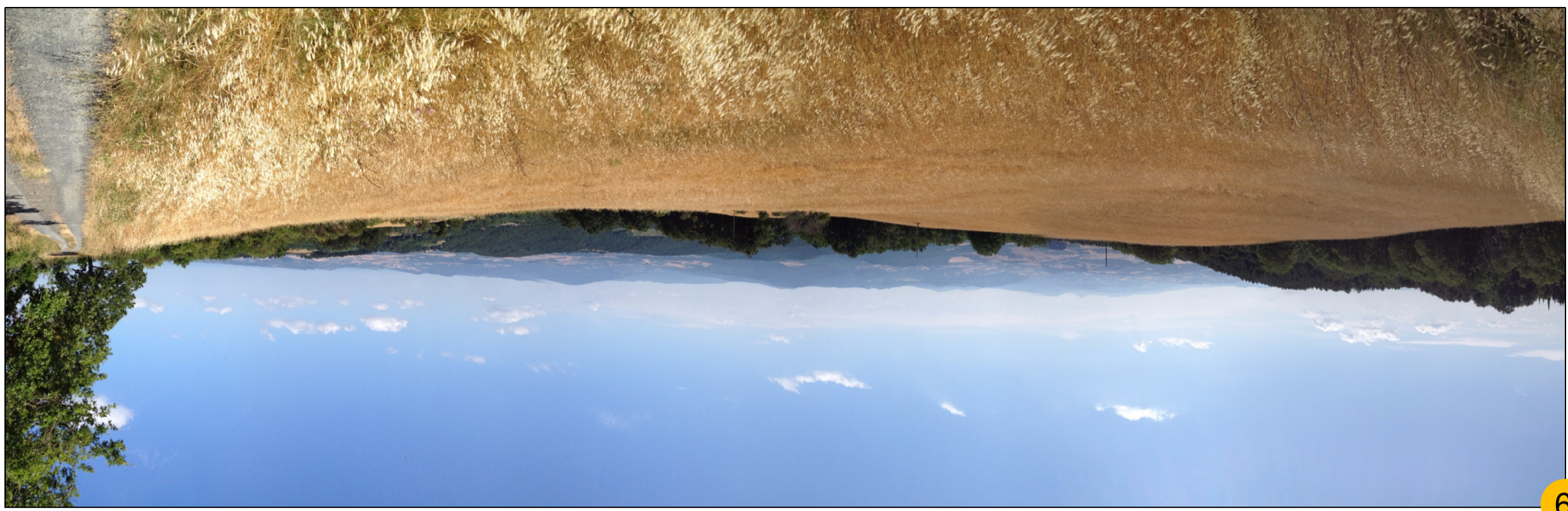
9 AREA POZZO CORTOLLA 1