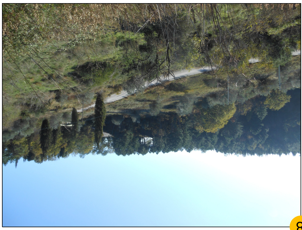
8 STRADA DI ACCESSO PER LA SONDA