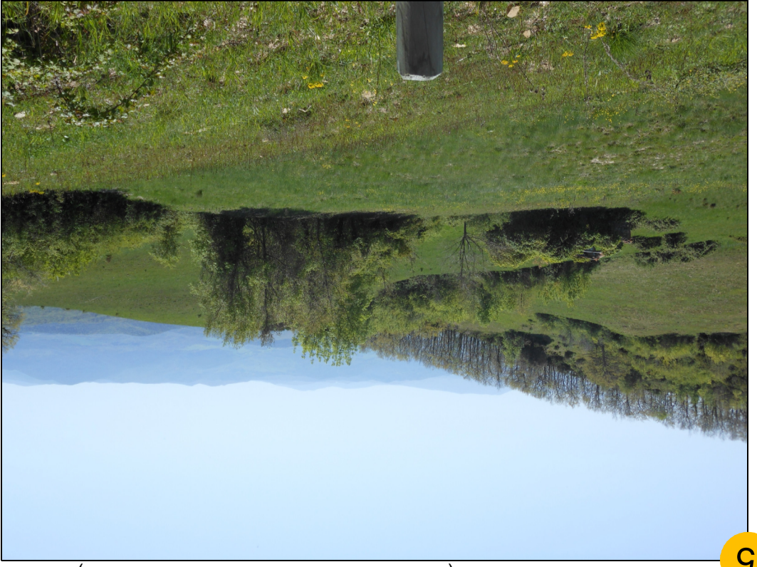
5 TRACCIATO PIPELINE (TRATTO IMPIANTO - CORTOLLA 2)