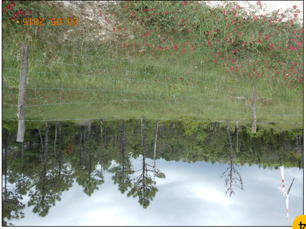
4 AREA DI ACCESSO ALLA POSTAZIONE CORTOLLA 2