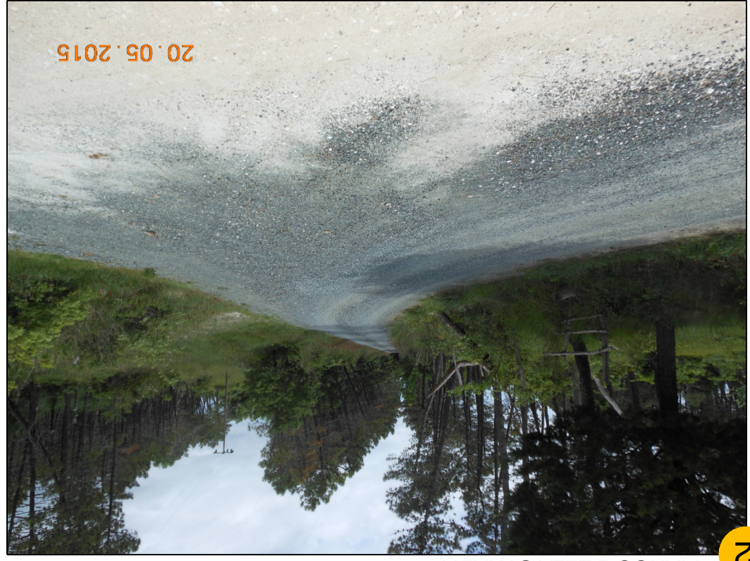
2 TRACCIATO PIPELINE (TRATTO IMPIANTO - CORTOLLA 2) AL FIANCO DELLA STRADA