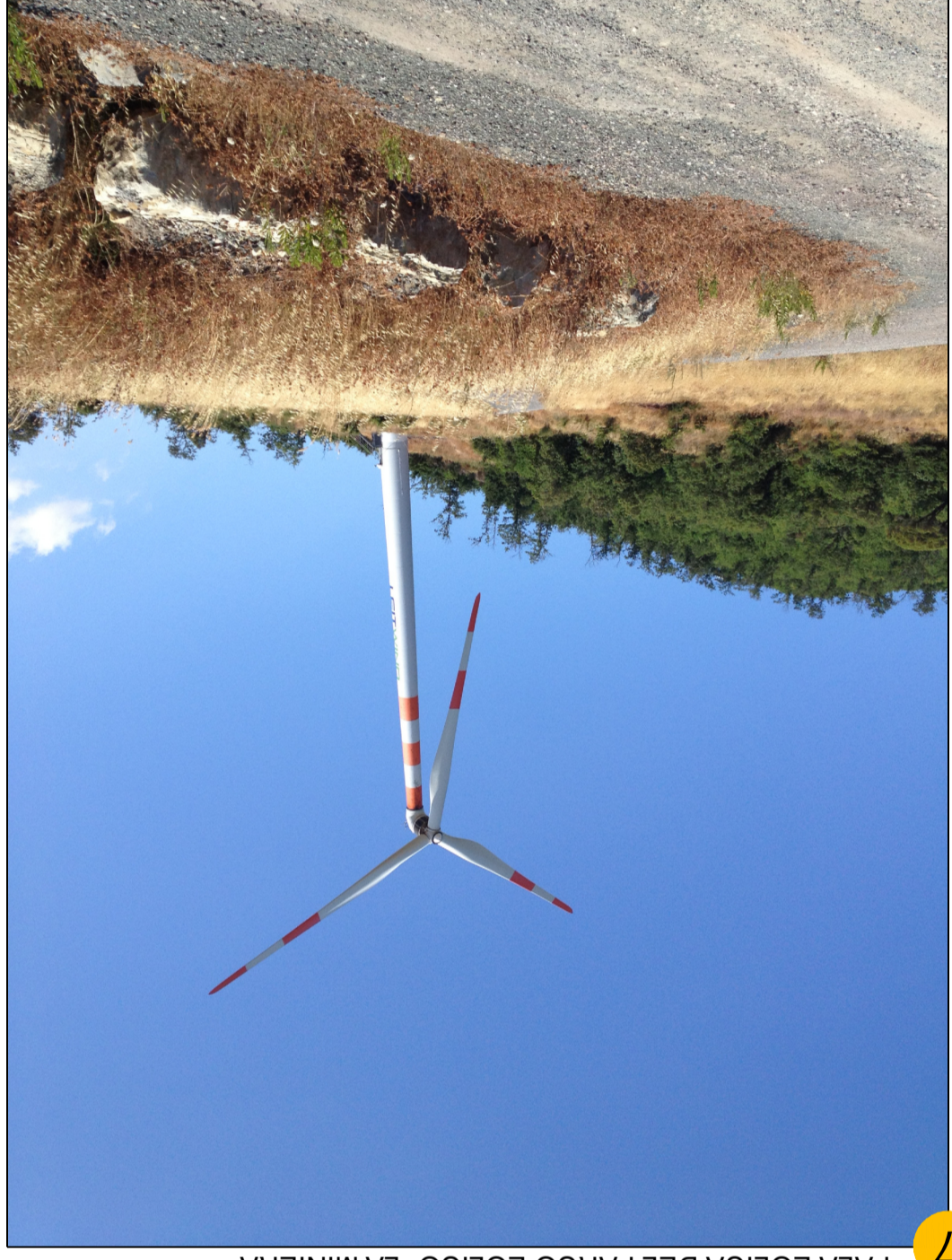
7 PALA EOLICA DEL PARCO EOLICO "LA MINIERA"