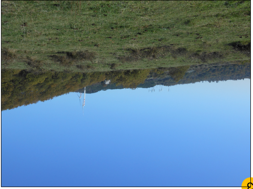
3 AREA DI IMPIANTO