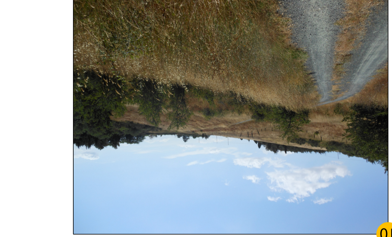
10 STRADA PRIVATA DI ACCESSO ALL'AREA POZZO CORTOLLA 1

PERMESSO DI RICERCA DI RISORSE GEOTERMICHE FINALIZZATO ALLA SPERIMENTAZIONE DI UN IMPIANTO PILOTA CONVENZIONALMENTE DENOMINATO "CORTOLLA" COMUNE DI MONTECATINI VAL DI CECINA - PROVINCIA DI PISA