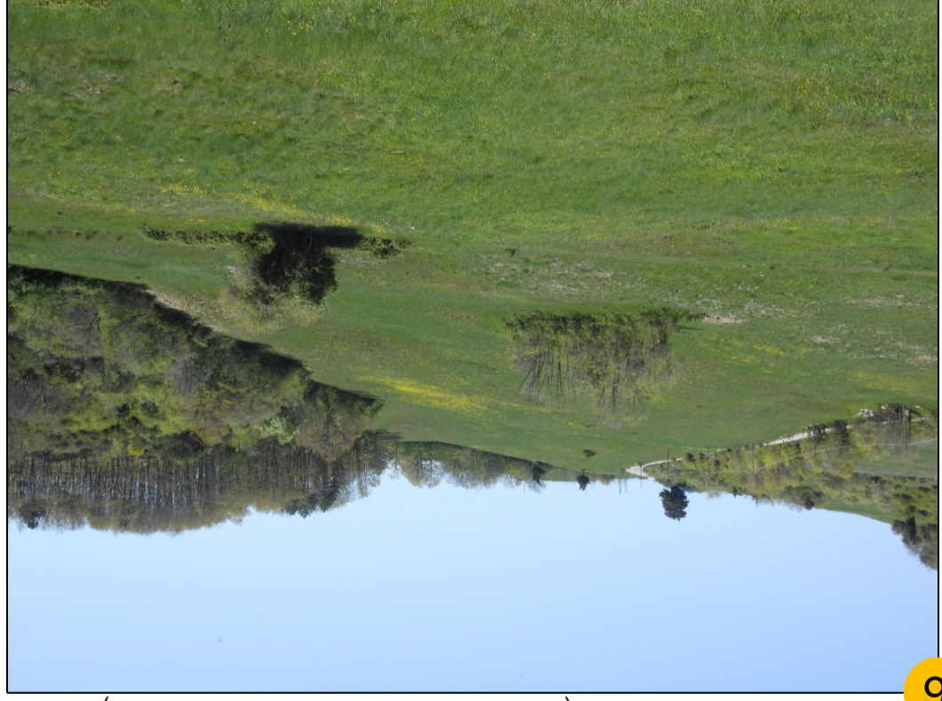
6 TRACCIATO PIPELINE (TRATTO IMPIANTO - CORTOLLA 2)