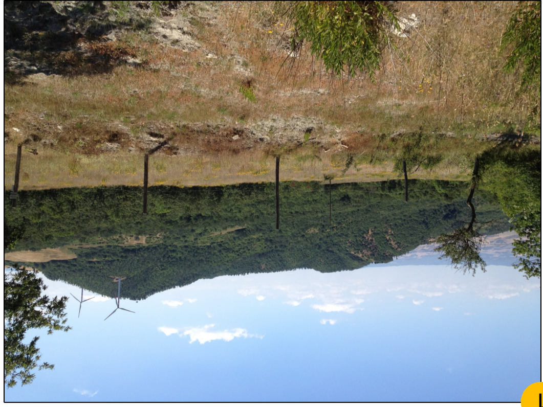
1 AREA POZZO CORTOLLA 2