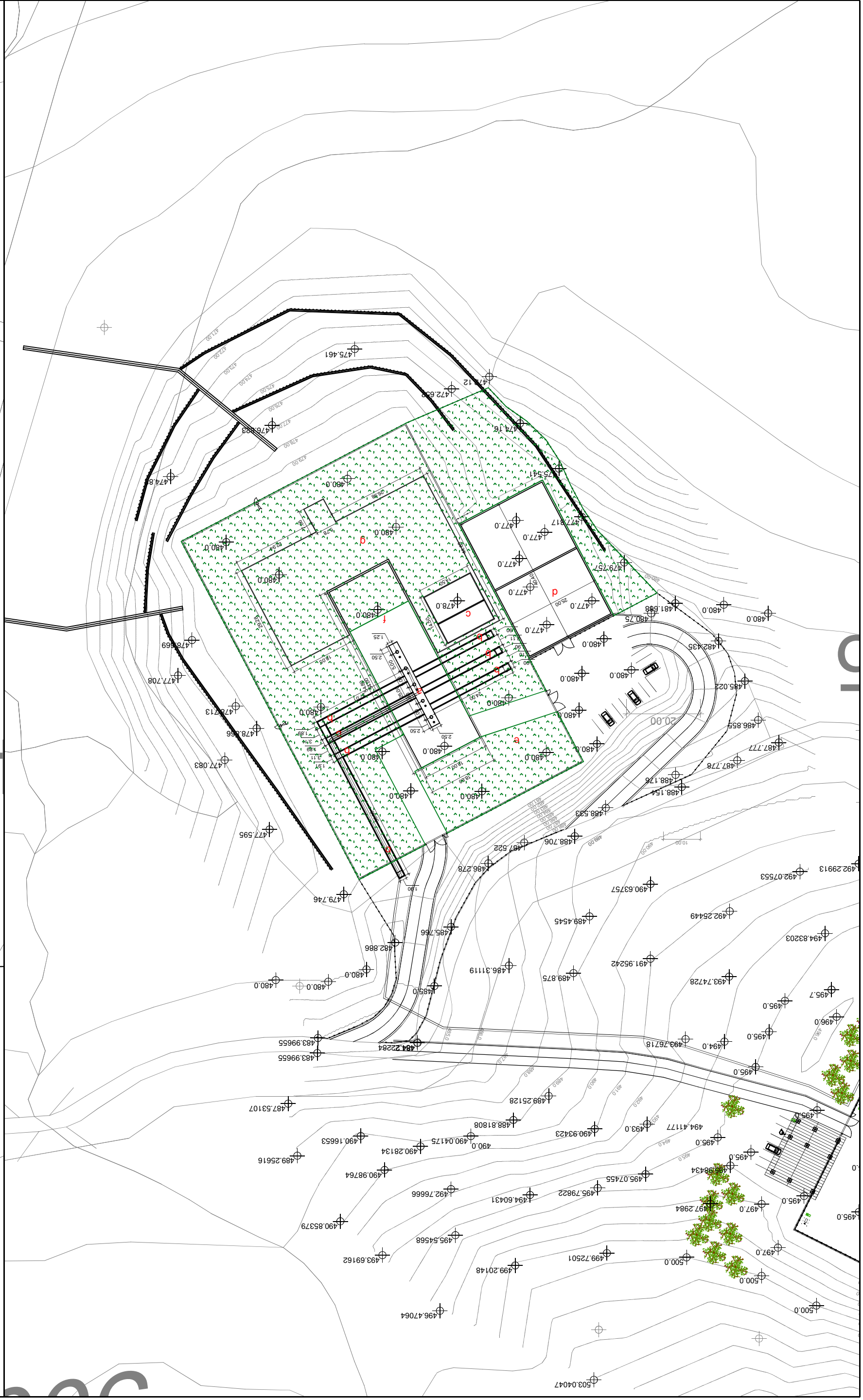
AREA POZZO CORTOLLA 1 1:1000