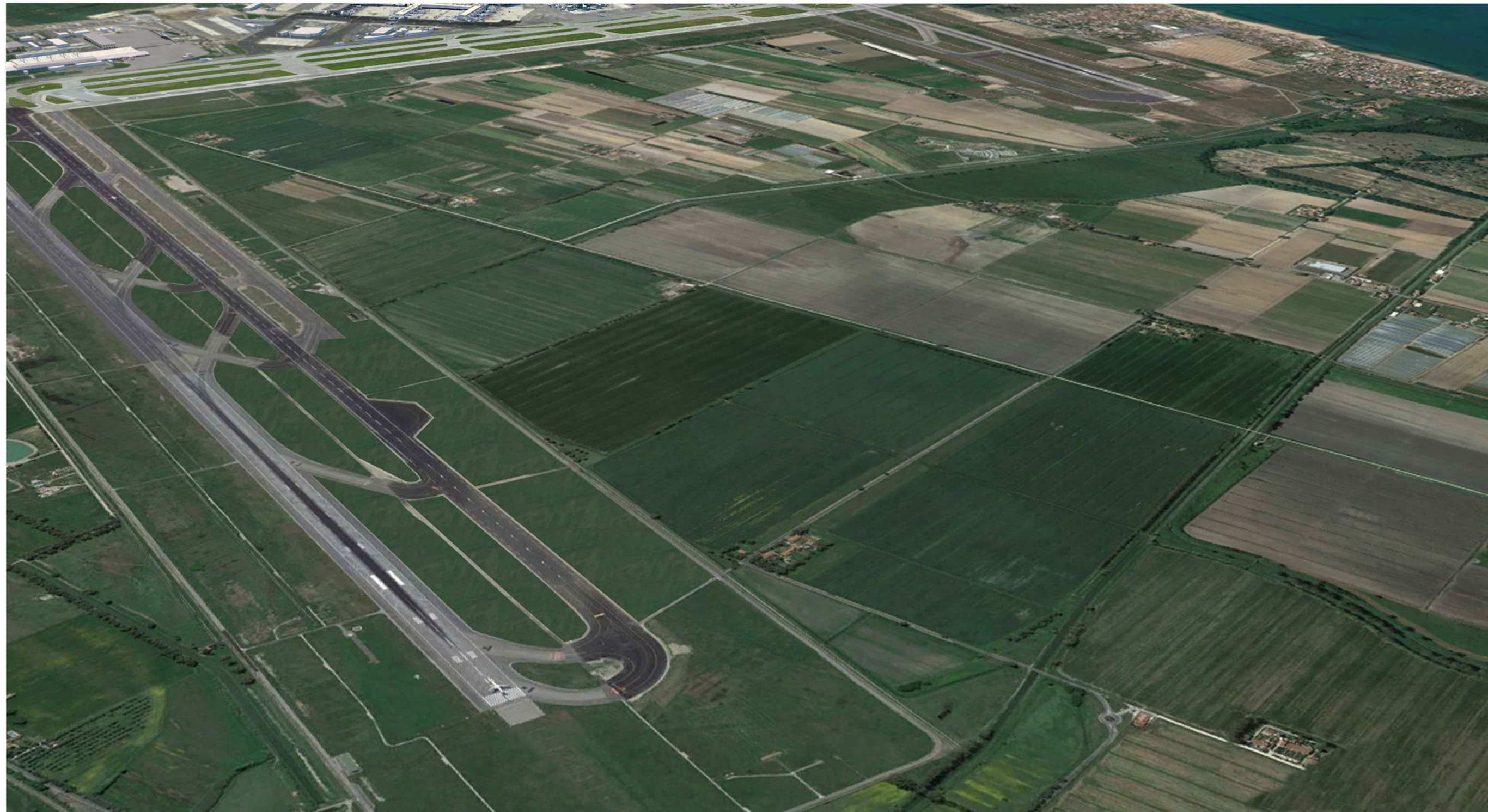
ANTE OPERAM - VISTA A VOLO D'UCCELLO DA NORD-EST