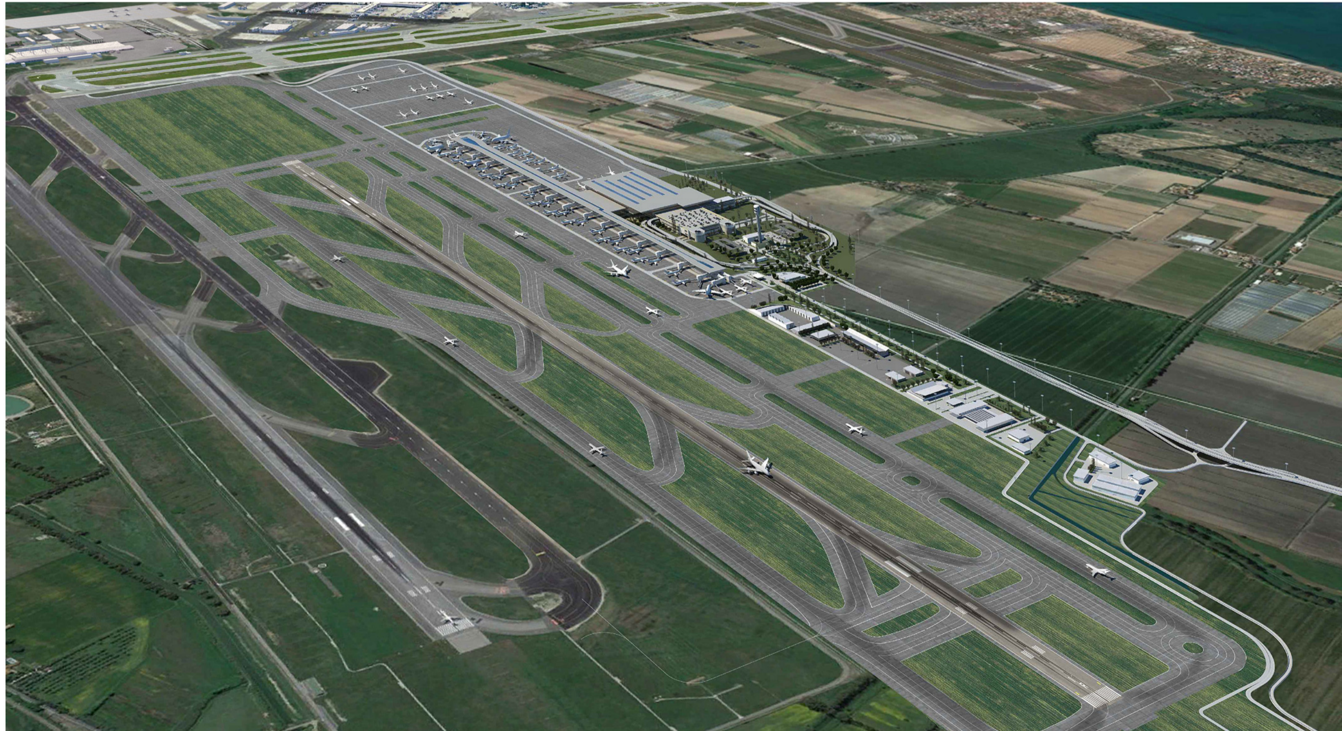
POST OPERAM - VISTA A VOLO D'UCCELLO DA NORD-EST