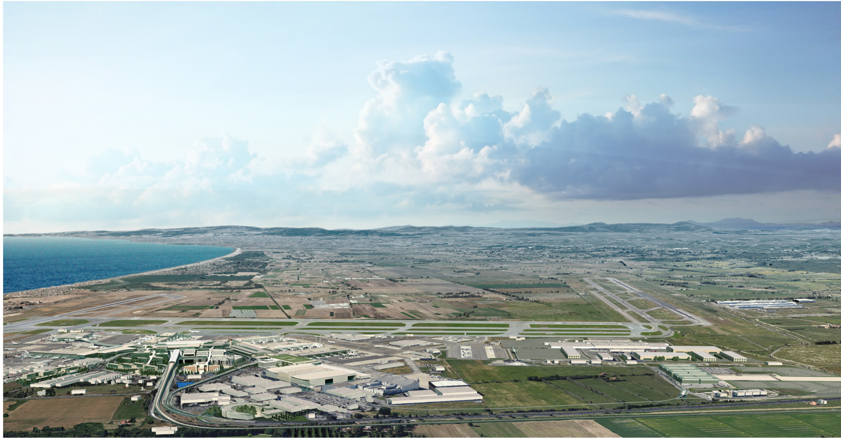
ANTE OPERAM - VISTA A VOLO D'UCCELLO DA SUD