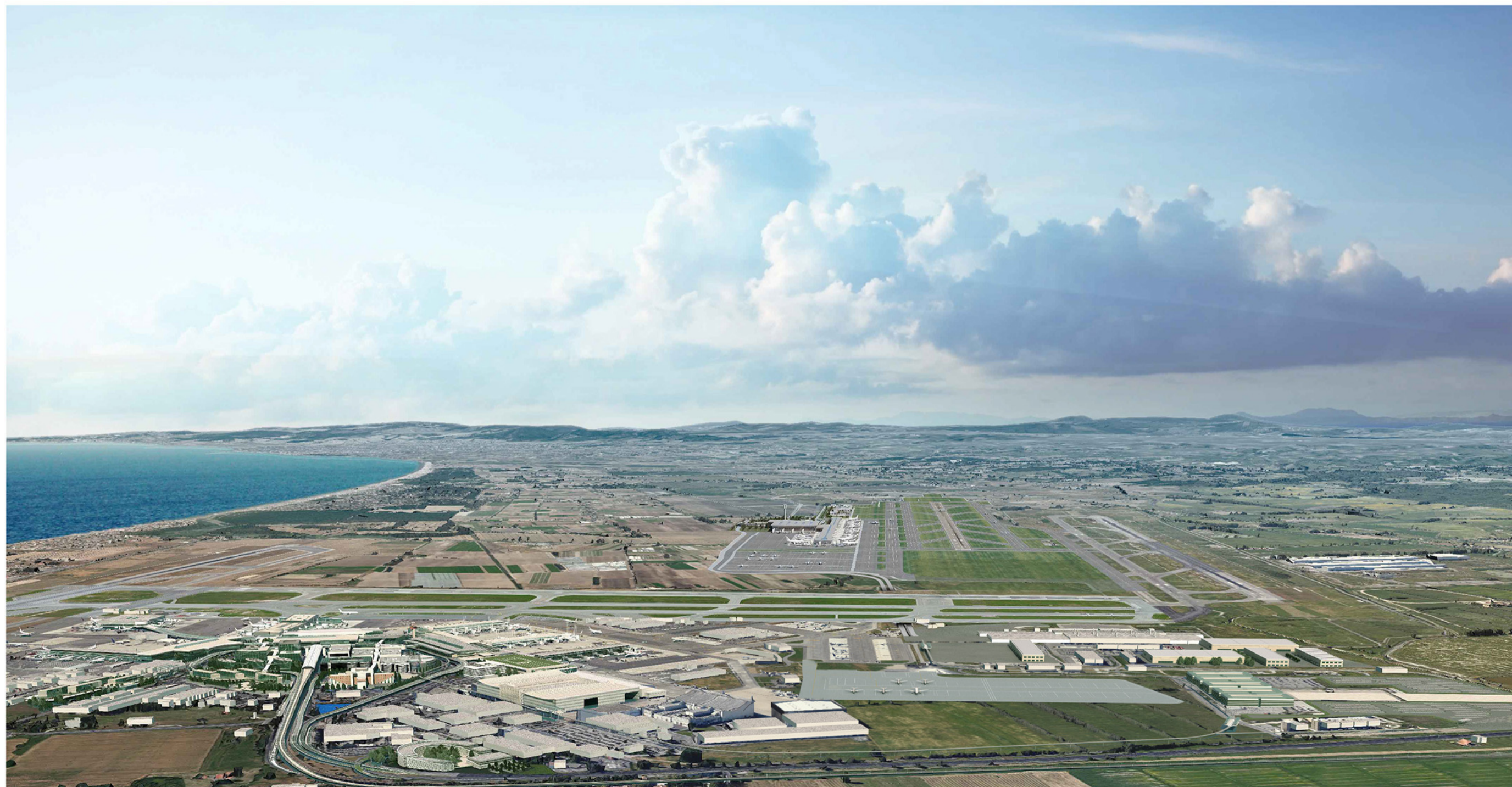
POST OPERAM - VISTA A VOLO D'UCCELLO DA SUD