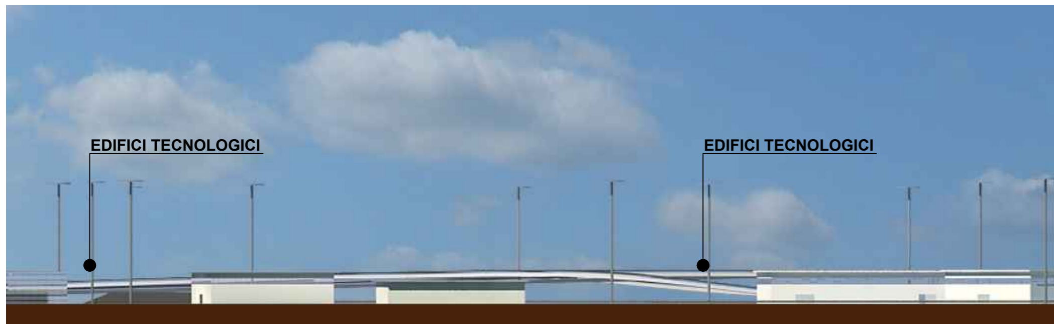
PROFILO EST 02- SEZIONE 07