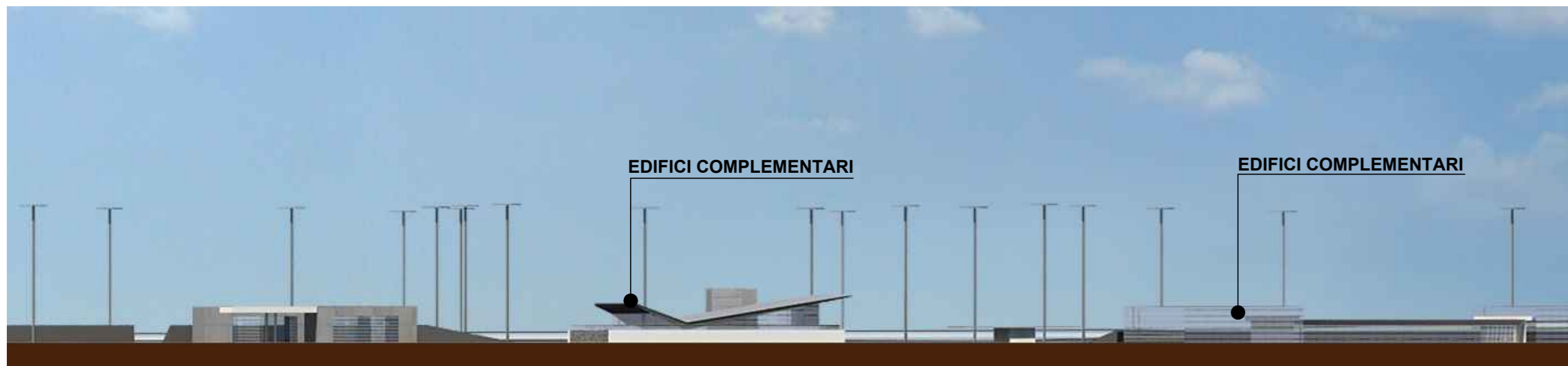
PROFILO EST 02- SEZIONE 06