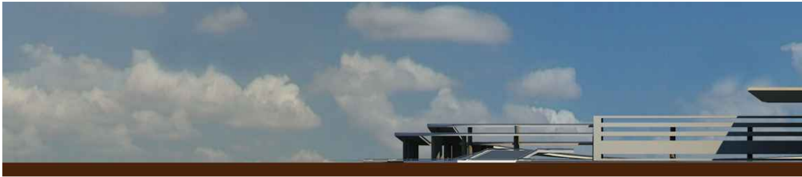
PROFILO SUD 01- SEZIONE 01