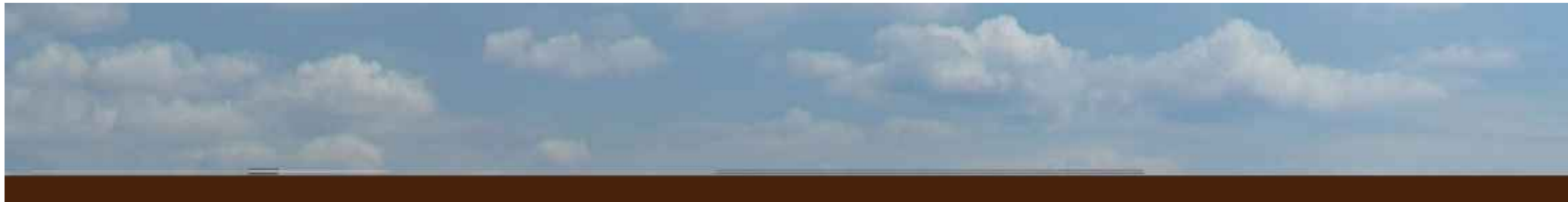
PROFILO SUD 01- SEZIONE 03