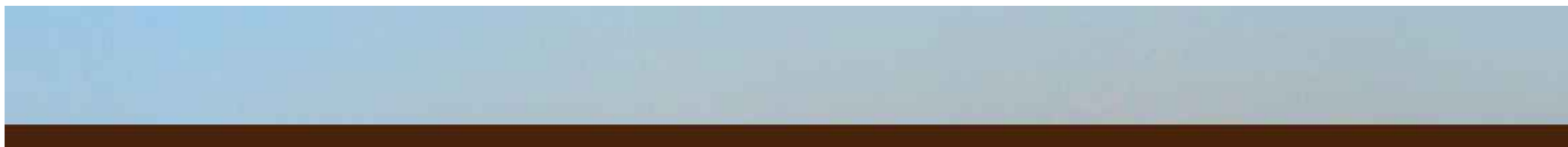
PROFILO SUD 01- SEZIONE 05